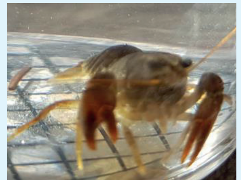
Photo d'une écrevisse vivant dans la Mèbre.