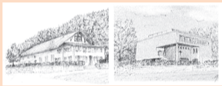
Saint-Amédée avant et après.

L'écrin a bien changé depuis la ferme qui a vu ses premiers paroissiens arriver en 1951, mais ce ne sont pas les apparences qui font l'âme d'une communauté, et celle-ci est toujours aussi vivante et dynamique qu'à ses débuts.