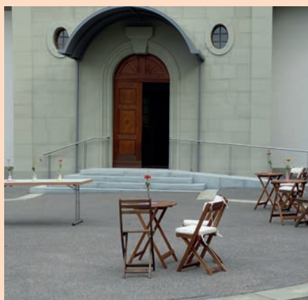
Un temple ouvert à nouveau.

Depuis quelque temps, le temple est à nouveau librement accessible au public; ceci tous les jours de la semaine, en matinée, de 8h à 12h. Pour ouvrir la porte, il vous suffira de passer votre main devant le senseur, à votre droite. Nous retrouvons ainsi la configuration telle qu'elle était il y a près de trois ans, avant l'irruption de la pandémie en mars 2020 et la fermeture des lieux publics.