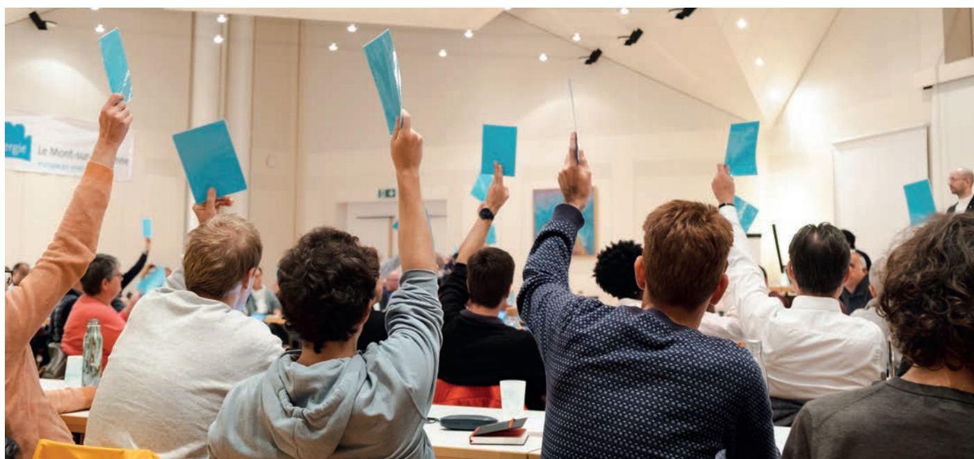
Immersion dans la salle du Conseil communal du Mont-sur-Lausanne.