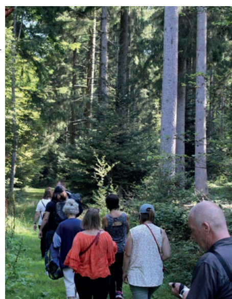
L'association Jorat parc naturel a publié son nouveau programme 2023.