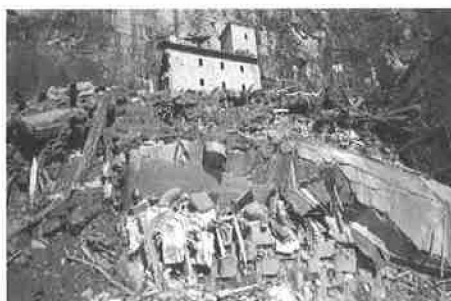
Gondo, octobre 2000

On continue toujours les mêmes travaux jusqu'à 11 h 00. Nous avons eu