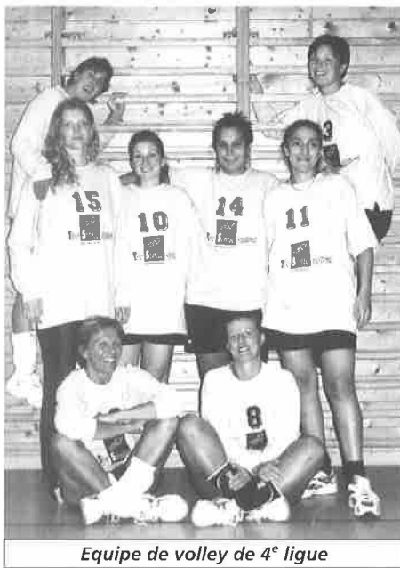
Equipe de volley de 4 e ligue