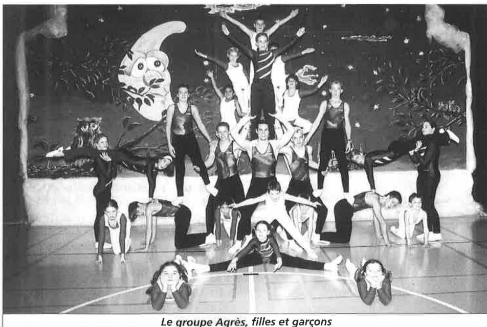
Le groupe Agrès, filles et garçons