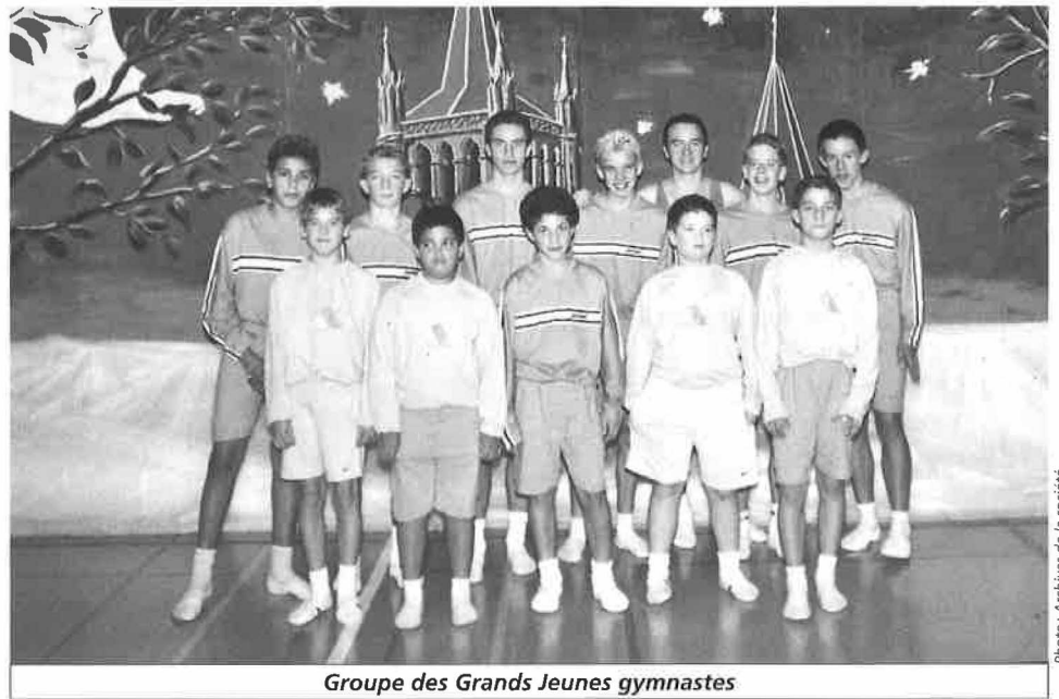
Groupe des Grands Jeunes gymnastes

Différents groupes nous ont fait vivre la diversification de l'interprétation de ce thème avec tout d'abord les apprentis sorciers qui, d'un coup de balai magique nous ont apporté toute la fraîcheur du groupe parents enfants. Puis ce fut le tour des enfantines avec une production toute en couleur qui nous a fait miroiter un kaléidoscope. La magie n'a pas été oubliée par nos jeunes filles 11-15 ans: «Abracadabra» un numéro de prestidigitateur. Puis ce fut au tour des petits jeunes gymnastes de jouer aux cartes avec le joker, et de nous montrer un aspect du jeu encore méconnu. Ensuite nous avons pu apprécier le travail de nos juniors avec leur production de Payerne fort bien préparée. La gym hommes nous a démontré qu'il est possible de pratiquer des sports d'extérieurs, à l'intérieur, et