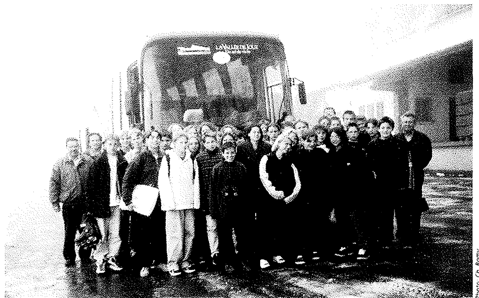
Les 3 e et 4 e années et leurs accompagnants

Après une partie de la nuit passée au déchargement, nous rejoignons la capitale au petit matin par une route déserte où les contrôles de la police et de l'armée nous surprennent dans