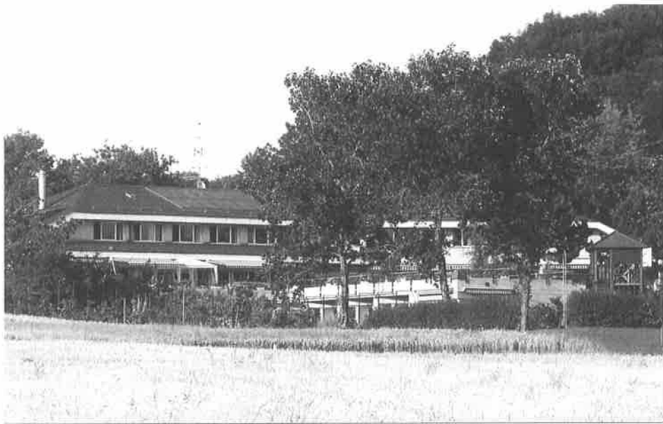
La Maison d'enfants « La Feuillère »