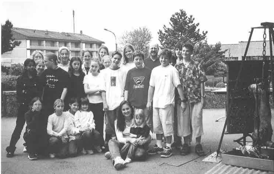
Journée de catéchisme de 1 re et 2 e année