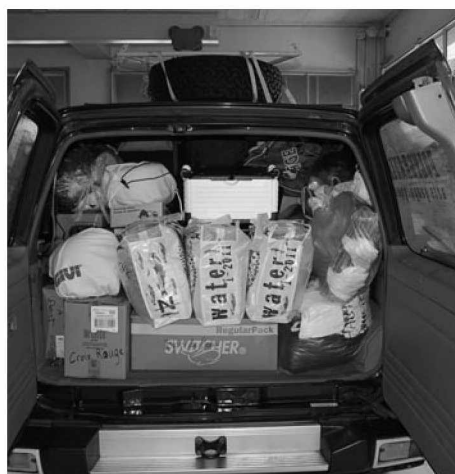
7 octobre, le chargement est complet

appris à dompter Edouard. Extraordinaire, incroyable, ce qu'un véhicule de ce type peut faire. Dimanche, cours sur la lecture du road book et de la boussole là; on a bûché, c'était un peu plus rébarbatif. L'après-midi nous sommes toutes parties sur les pistes du Château; départ cap 250° sur 565 mètres, ensuite prendre Piste Principale sur 630 mètres, etc. Nous nous sommes perdues. Demi-tour et on recommence, nous avons bien entendu beaucoup rigolé, tirés plein de caps et sommes finalement arrivées à bon port. Un cours mécanique nous attendait, changement de roue, nettoyage du filtre à air, etc. La journée fut très instructive.