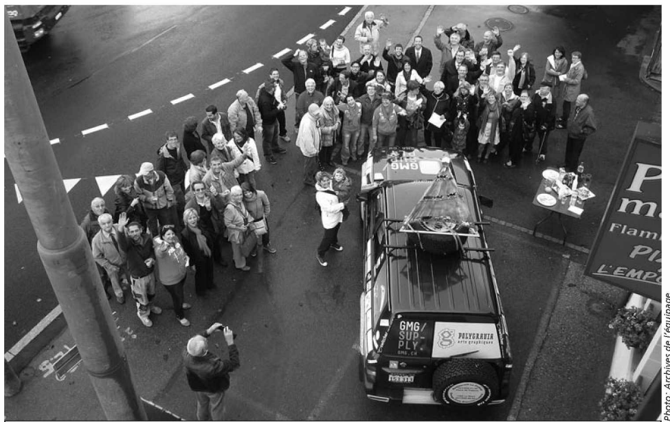
Départ pour le rallye le mardi 9 octobre 2012

Le 9 mars 2012 nous avons pris la route pour quelque 700 kilomètres, notre Patrol en pleine forme, nous avons rejoint Narbonne, plus exactement le domaine du Château Lastours. Là, nous avons fait la connaissance de futures Roses. Samedi matin, baptême de la jeep, elle se nomme «Edouard». Premier cours sur le fonctionnement du 4x4, l'après-midi «balade» sur des terrains «caillasseux» et vertigineux, on a