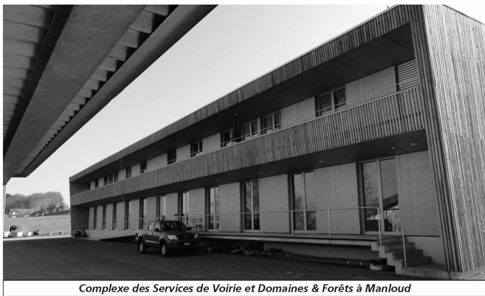
Complexe des Services de Voirie et Domaines & Forêts à Manloud

Des précisions ainsi que les modalités d'inscription vous parviendront par un tous-ménages que vous pourrez rapporter dans une urne prévue à cet effet, lors de la Fête de mai du samedi 4 mai 2013 sur la Place du Petit-Mont.