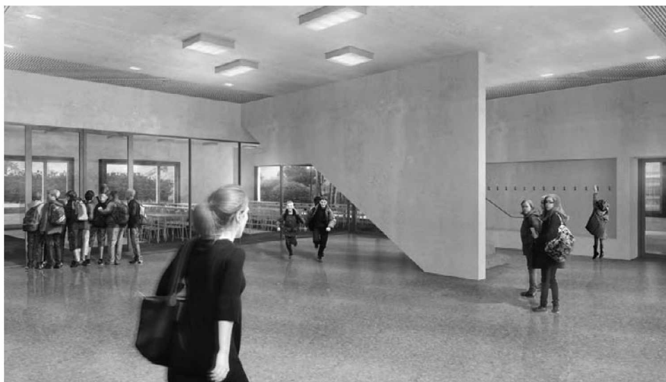
Le réfectoire et la salle polyvalente s'organisent autour d'un hall pouvant servir de foyer ou de lieu d'exposition