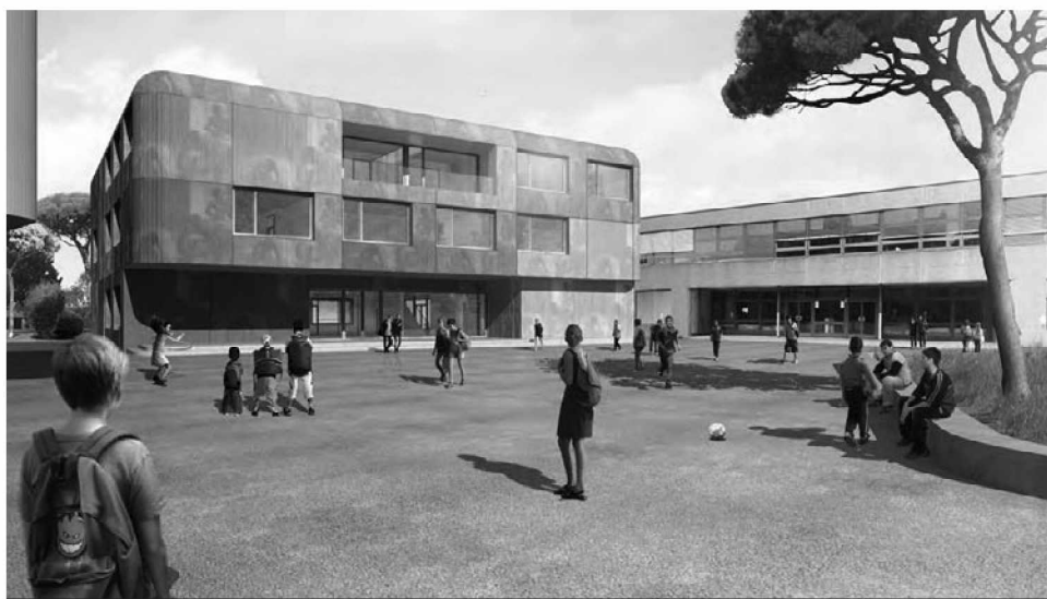
La cour se faufile entre les constructions et s'accroche au nouvel accès principal du site sur la rue de Lausanne

Ces visites, sur inscription et gratuites, sont d'ores et déjà programmées au samedi 8 juin 2013 à 09h00, en cas d'affluence, une 2 e visite aura lieu à 13h00.