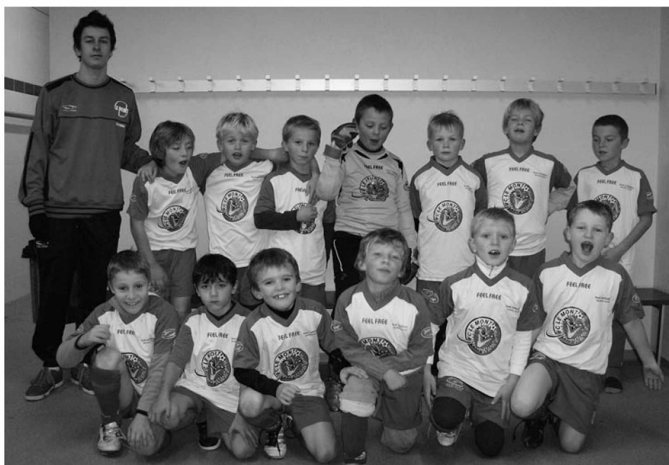
L'équipe fin 2012: Bravo aux F1, joueurs et entraîneurs qui ont brillamment remporté le tournoi en salle de La Sallaz