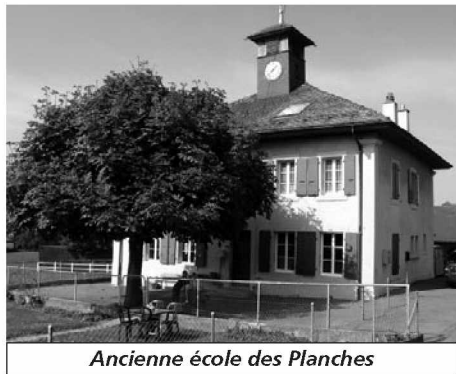
Ancienne école des Planches