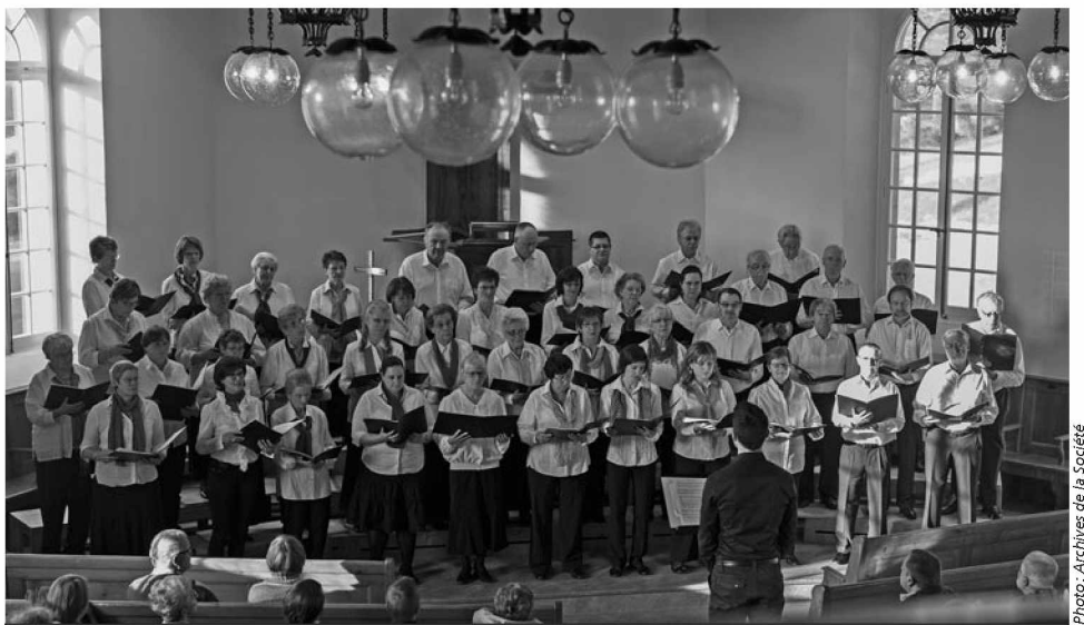
L'Echo des Bois au Temple du Mont