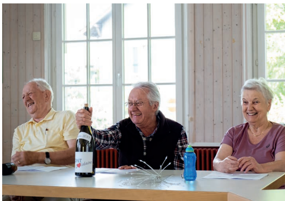
Difficile de garder son sérieux lors des répétitions du sketch « La baguette magique ». Les comédiens amateurs du Mont Solidaire prennent un malin plaisir à caricaturer leur propre personnalité.

L'association Mont Solidaire propose de nombreuses activités tout au long de l'année (pour les membres ou non dès 55 ans) : café solidaire, jass, pétanque, tricot, biodiversité (Jardimont), marche en forêt, cybercafé, activités culturelles, etc.