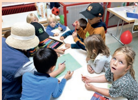
« Explorer la Bible » © Adrinée Burdet

à EXPLOR'BIBLE (ou culte de l'enfance) à la maison de paroisse