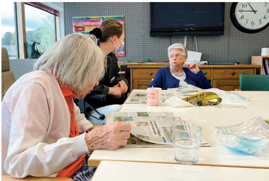
Moment de discussion et d'échange au Centre d'accueil temporaire de La Paix du Soir.

A La Paix du Soir, tout est fait pour que les bénéficiaires gagnent en autonomie et en qualité de vie. Un projet d'accompagnement avec des objectifs à atteindre est ainsi fixé conjointement avec chaque