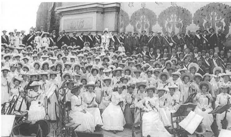
Chœur vaudois.