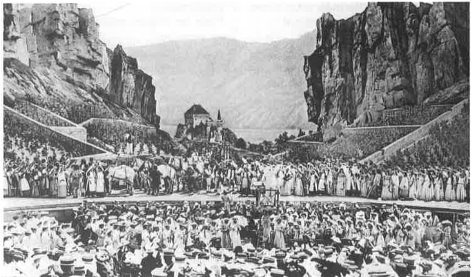
Festival vaudois, acte premier.

La foule en liesse est emportée par un patriotisme musical sans précédent: 2'500 acteurs et chanteurs, venus de 30 villages vaudois, se produisent devant 20'000 spectateurs. Or cet ardent journaliste n'a pas remarqué la présence d'une dame âgée, fière et élégante, qui suit le spectacle avec attention. Son visage est noble, incisif, orné (!) d'un nez majestueux. Elle discute, en allemand, avec un homme jeune, aux traits avenants, rehaussés d'un nez similaire. Ils dirigent le Festival de Bayreuth, et s'intéressent à cette super-production vaudoise. Bien sûr, c'est Cosima Wagner, accompagnée de son fils Siegfried. Le plus surprenant c'est que ces deux illustres musiciens s'engagent ensuite dans une discussion passionnée avec un homme jeune, au visage austère mais rayonnant, surmonté d'un chapeau blanc assorti à un