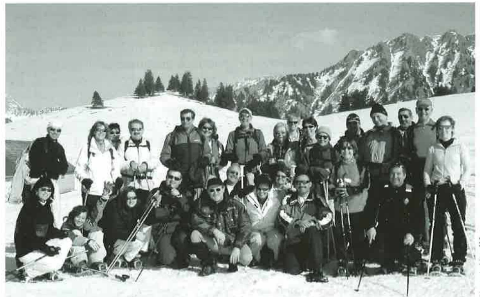
La sortie hivernale en raquettes de la Gym

Si vous devez effectuer un séjour à l'hôpital ou en clinique, sachez que vous devez informer le secrétariat