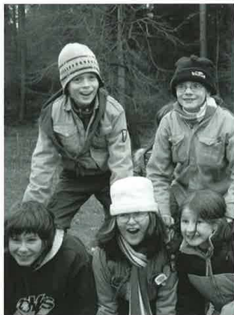
Scouts « La Croisée »