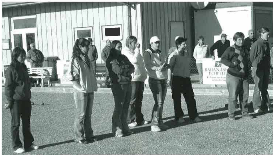
Le Cadre Suisse Féminin

petanque.lemont@hotmail.com ou directement au Boulodrome à la place du Châtaignier (jeudi soir de 19h30 à 23h00, samedi de 13h30 à 18h00 et dimanche de 10h00 à 13h00).