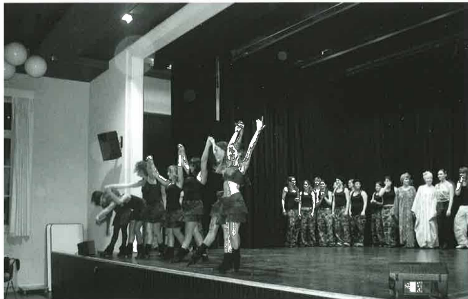
Démonstration de danse (Power Dance) lors de l'accueil des nouveaux habitants