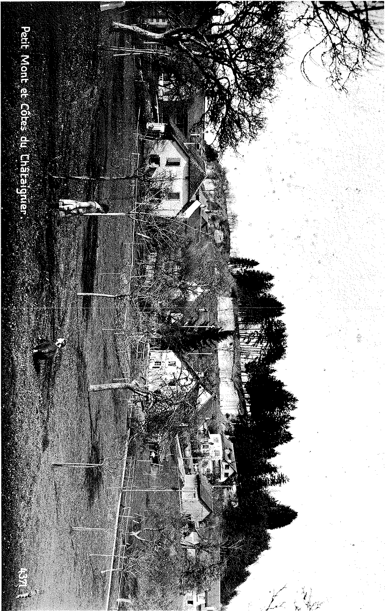
Petit Mont et Côtes du Châtaignier