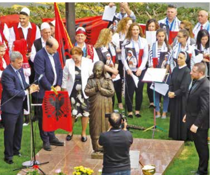
Photographie: Panayotis Stelios

Panayotis Stelios Président du Conseil de Communauté