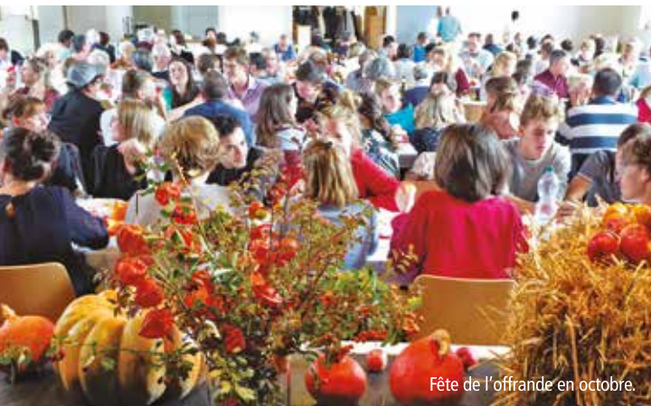
Fête de l'offrande en octobre.