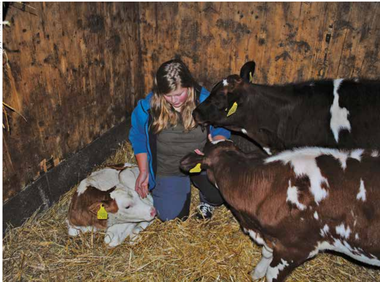
Paix, chaleur et bienveillance : préparation de Noël.