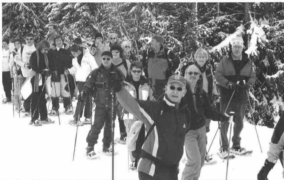
FSG - Sortie à ski

Nous rappelons aux tireurs astreints domiciliés dans la Commune que le fait d'accomplir leurs tirs obligatoires dans des stands se situant dans des commune voisines, peut occasionner une facturation de frais