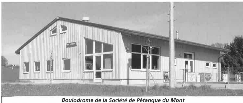
Boulodrome de la Société de Pétanque du Mont