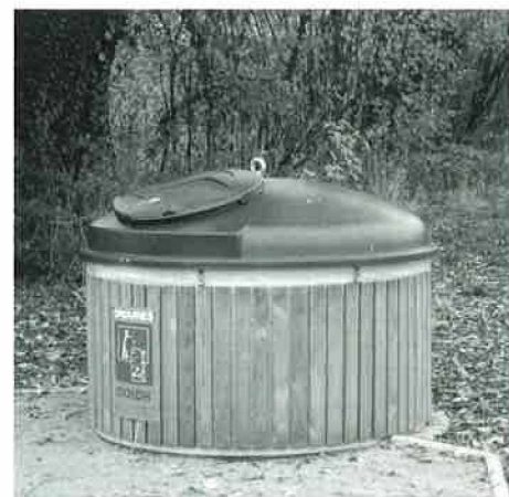
Concept « Molok »

L'installation, à titre d'essai, de cuves semi-enterrées du type « Molok », sur trois sites de notre Commune, a rencontré un écho très favorable auprès des habitants des quartiers concernés. Il faut rappeler que l'implantation de ce système est étudiée en fonction d'un