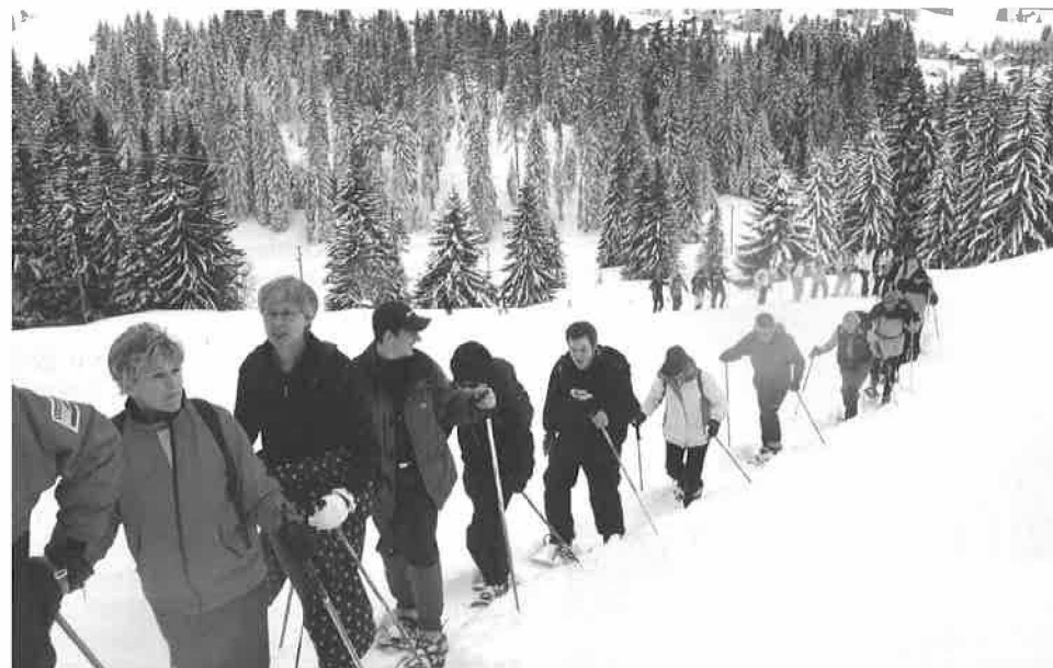
FSG - Sortie à ski