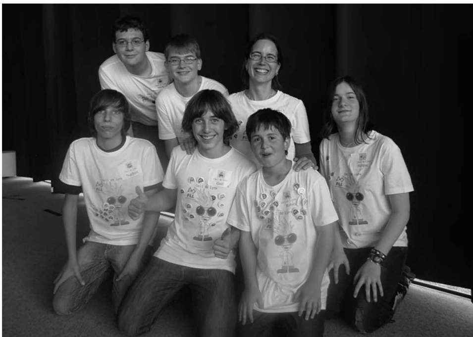
L'équipe « Œil de Lynx » qui a rapporté le trophée FLL 2010 de robotique

Le concours de robotique consiste à construire un robot avec du matériel LEGO et à le programmer pour relever des missions sur un plateau de jeu identique pour tous les participants. Chaque équipe reçoit la description des missions, huit semaines avant le concours. La durée d'un match est de deux minutes et trente secondes. Durant ce laps de temps, chaque équipe essaie de réussir le maximum de