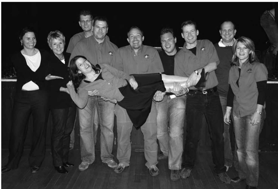
Société de Développement

Le comité a également envoyé à tous les nouveaux habitants (350 adresses fournies par la Commune) une invitation personnelle afin de participer à cette soirée. Nouveaux habitants enregistrés au Mont-sur-Lausanne du 1 er janvier au 31 décembre 2010.