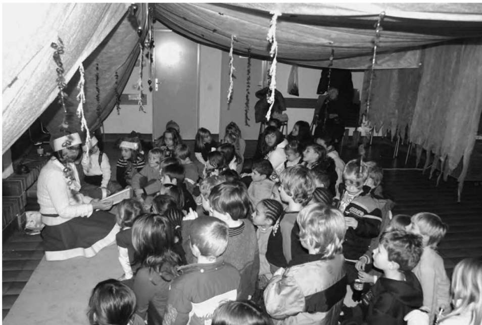
Société de Développement - St-Nicolas 2010