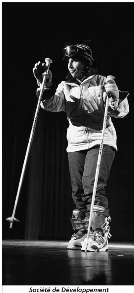
Société de Développement

comité de la SDM dont les membres bossent comme des fous tout au long de l'année pour organiser, préparer et réaliser toutes nos manifestations. Et sans exagérer, en plus des comités, il y a quelques heures de travail. Sans compter qu'ils doivent supporter en plus le Président. Donc merci beaucoup au comité de la Société de Développement.