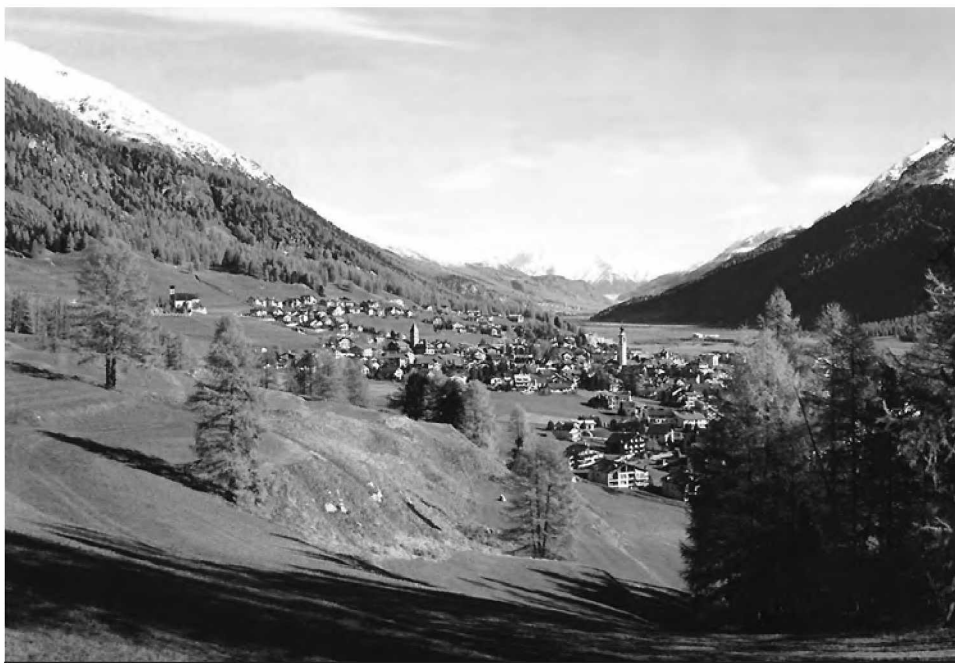
Samedan dans la vallée de la Haute-Engadine