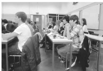
Première session de notre groupe parlementaire aux casernes.