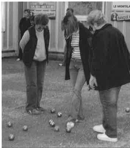
Concours des Paysannes vaudoises

Un 2 e mini-concours s'est déroulé le lundi 24 avril avec la participation des Paysannes Vaudoises du Mont. 28 d'entre elles se sont affrontées lors de parties très disputées. Lors de cette 4 e édition, nous constatons que c'est tou-