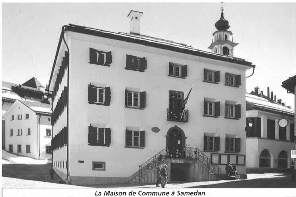
La Maison de Commune à Samedan