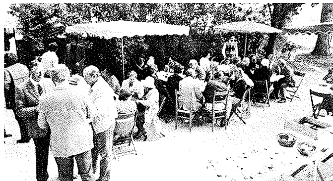
Où chacun se régale

Voici, ci-dessous, quelques souvenirs de cette journée.