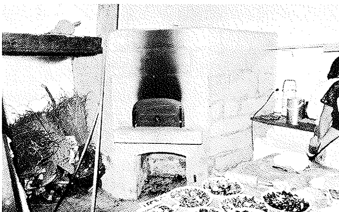
Le voilà, ce four

Sous l'égide du Conseil de paroisse, aidé par les dames de l'Association des paysannes vaudoises, le four curial fut inauguré le dimanche 3 octobre, en présence