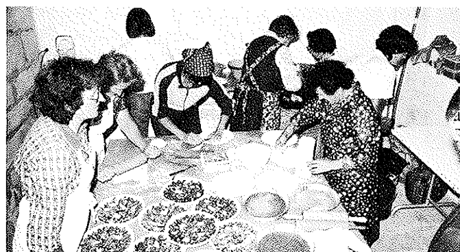
En pleine action