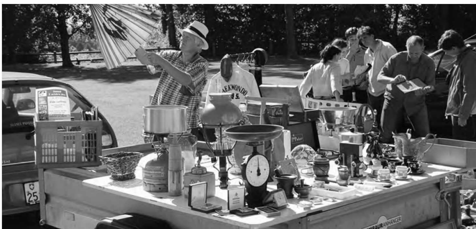
Le vide-coffres 2010 au Châtaignier

Cette année, leur tournoi a débuté le 21 avril et s'est clôturé le 15 septembre. Il a réuni entre 25 et 30 joueurs par mercredi. Le classement tient compte des 15 meilleurs résultats personnels.