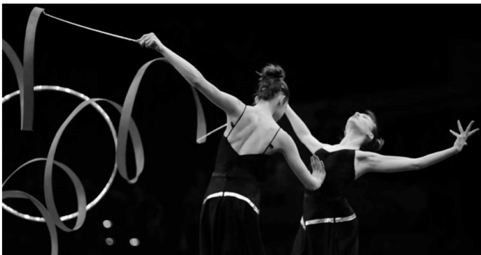
Gymnaestrada 2011 à Lausanne