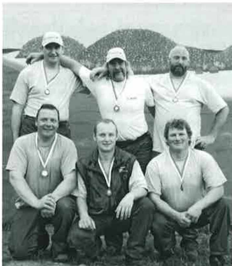
L'équipe du tir à la corde « Le Mont 1993 »

www.ape-vaud.ch/lemont E-mail: apelemont@hotmail.com