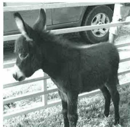
Le chouchou de la fête

Les animaux de la ferme furent le clou de la fête! Un immense merci à leurs propriétaires qui ont accepté de préparer les parcs et de transporter leur bétail pour une journée. Les vaches du Chalet Boverat, du Chalet de la Ville, des Vuarnes, de la Marjolatte toutes plus belles les unes que les autres, pâturaient ensemble pour l'occasion: Holstein, Simmental, Montbéliarde, Normande, Brown-Swiss et Aubrac; même le taureau des Vuarnes était de la partie. On pouvait admirer les chèvres et le lapin du Chalet de la Ville; la belle truie, les oies et les poules de Marjolatte; trois chèvres de Cugy; les moutons et la famille d'ânes de Praz-Longet dont le petit de 3 semaines a tenu la vedette. Plus actifs depuis le matin, deux chevaux attelés au char de marathon de la famille Chabloz ont permis à de nombreux participants de profiter d'une balade en forêt.