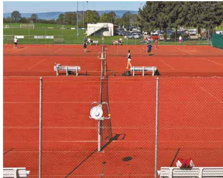
Tournoi d'Ouverture 2018.