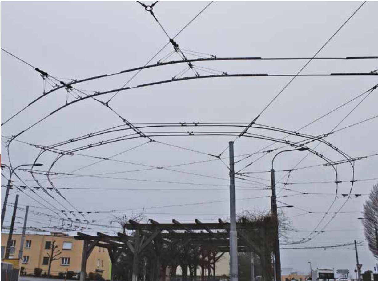
Terminus du 8, un p'tit tour et puis s'en va.