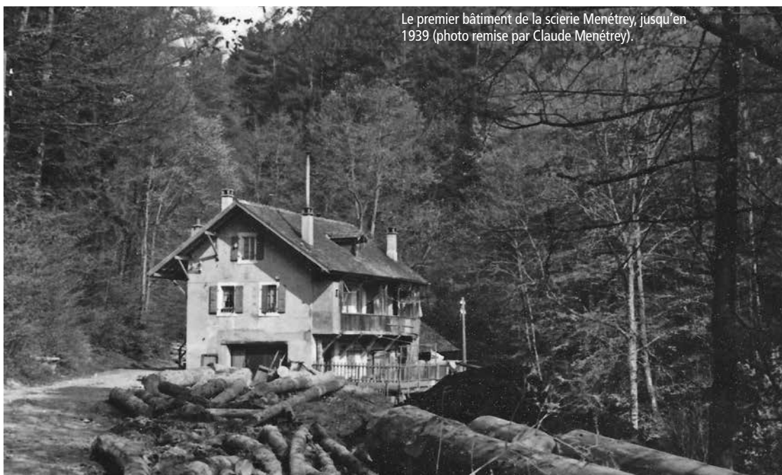
Le premier bâtiment de la scierie Menétrey, jusqu'en 1939.