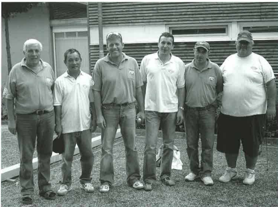
Pétanque: en blanc l'équipe du Mont vainqueur face aux Azzuris de Lausanne