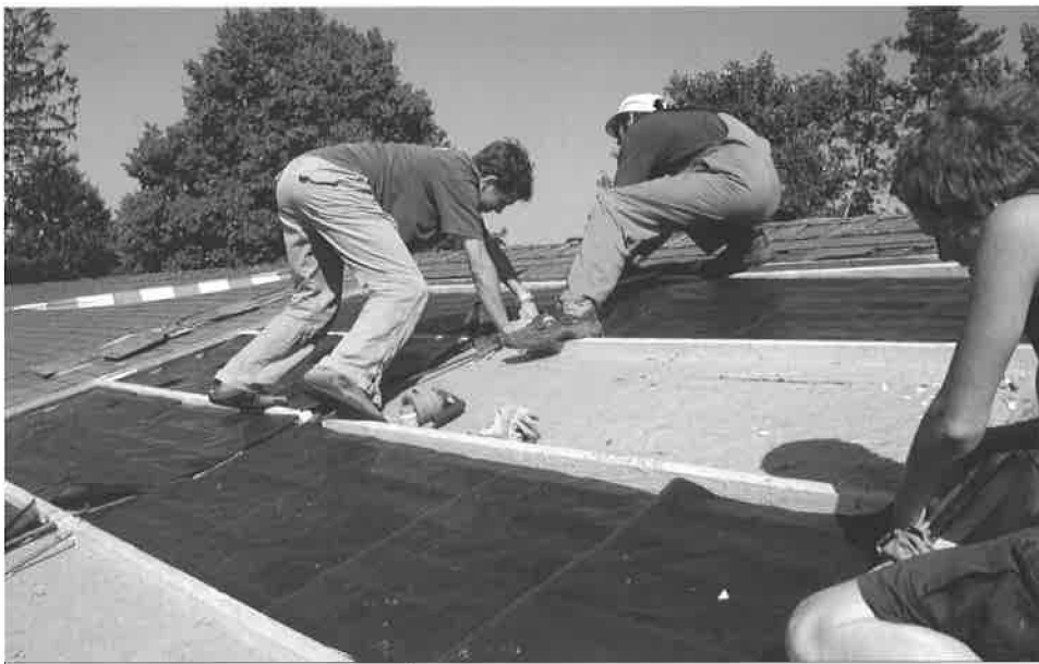
Les gymnasiens au travail sur le toit de l'EMS