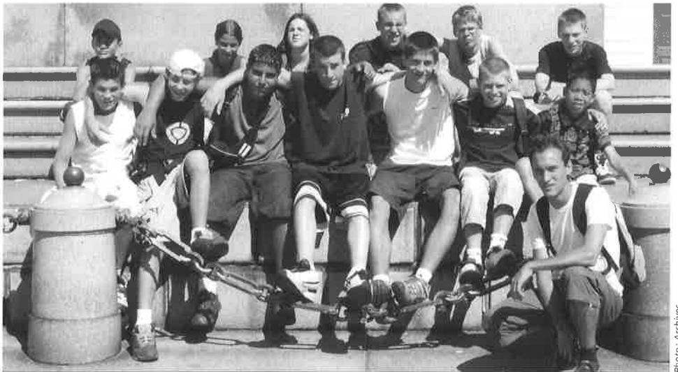
La délégation du Mont à Graz

Cette année, la délégation du Mont a concentré ses efforts sur l'athlétisme et le beach handball, tout nouveau sport à