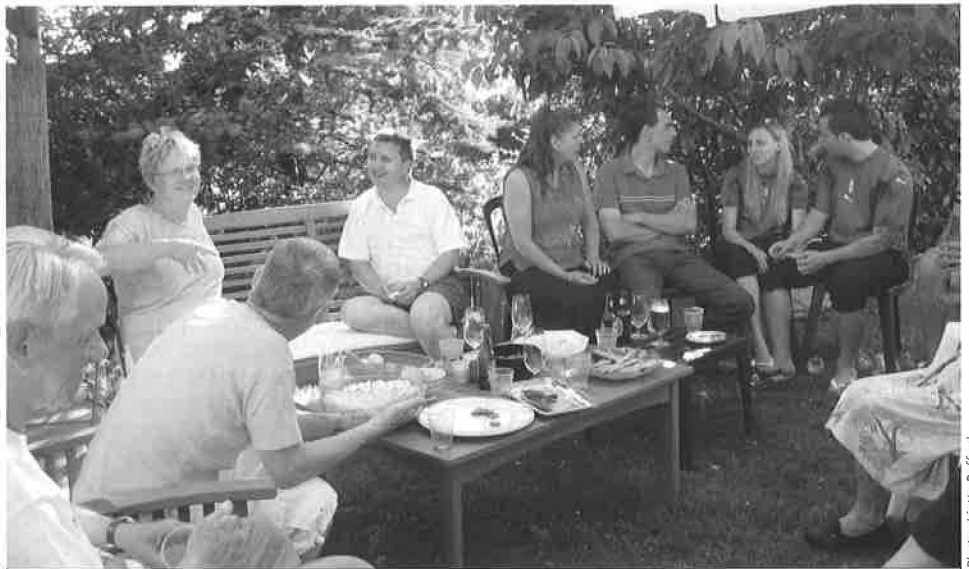
Fête de quartier au chemin du Saux

Par ce message, nous souhaitons vous faire partager notre plaisir à avoir fait