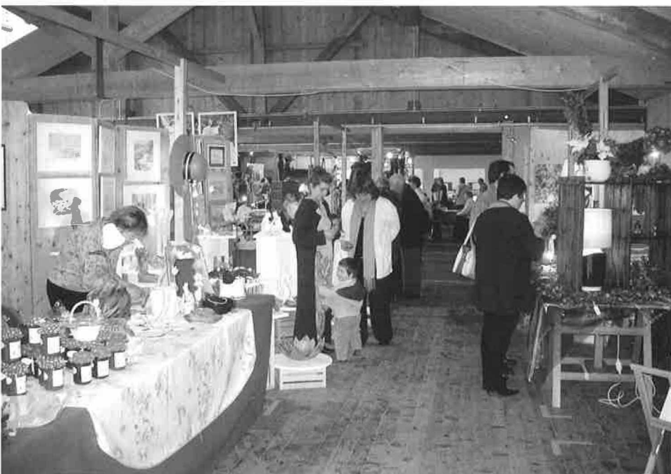
Marché des artistes et artisans du Mont