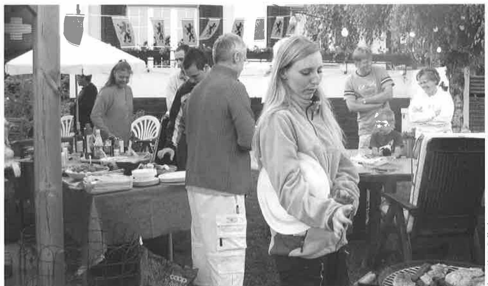
Fête de quartier au chemin du Saux

Ajoutons que les troubles du comportement sont la plupart du temps l'expression d'un problème sous-jacent qui peut aller d'une mauvaise condition de