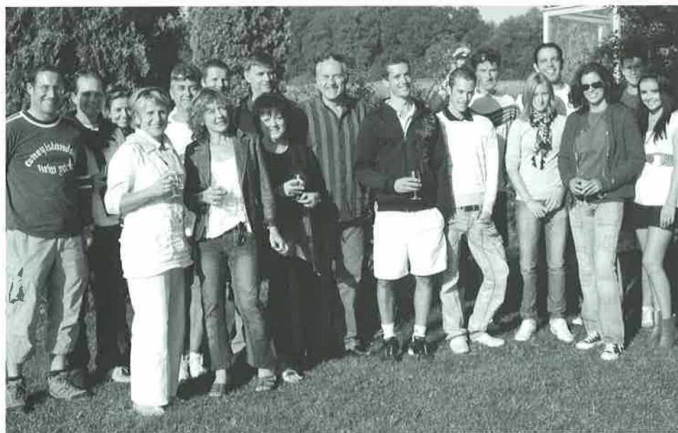
Le TC Le Châtaignier lors du tournoi interne