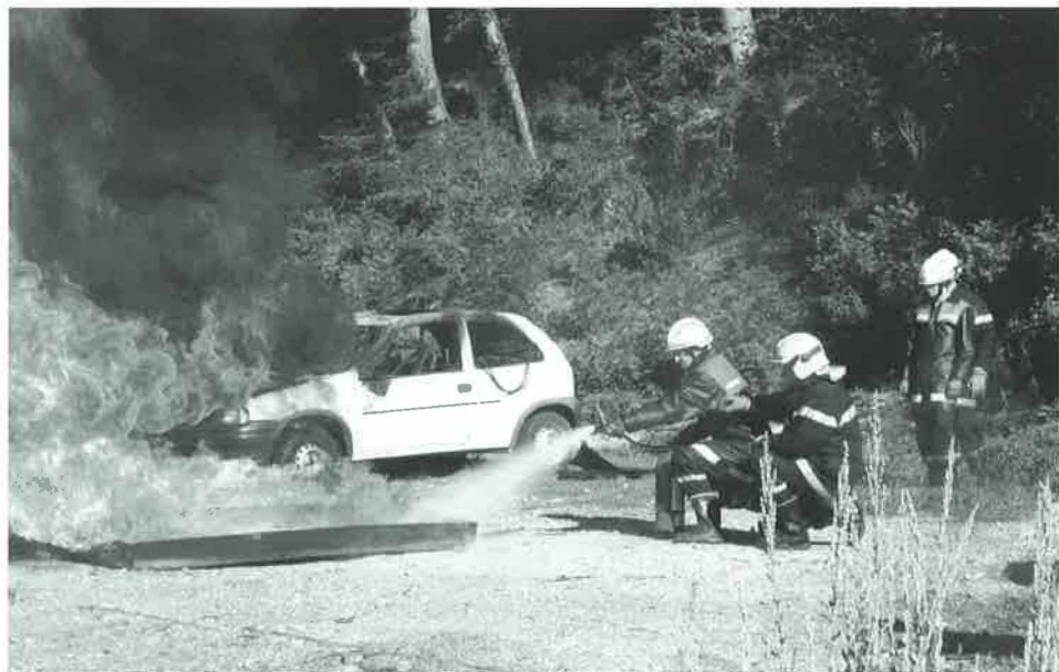
Ça chauffe dans un exercice d'extinction à Gollion

Le jeune, intéressé à faire partie du groupe de Jeunes Sapeurs, doit s'annoncer par téléphone au 021 652 78 96 (répondeur) et il lui sera envoyé un formulaire d'inscription.