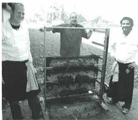
Le marché des artistes et artisans

Et pour 2009, notez bien la dernière manifestation de la Société de Développement, soit la St-Nicolas le samedi 5 décembre au Châtaigner. Le comité de la SDM se réjouit déjà de vous y retrouver.