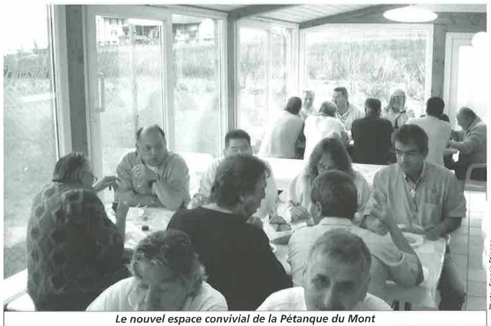
Le nouvel espace convivial de la Pétanque du Mont