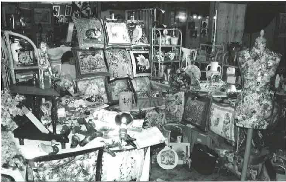
Le marché des artistes et artisans