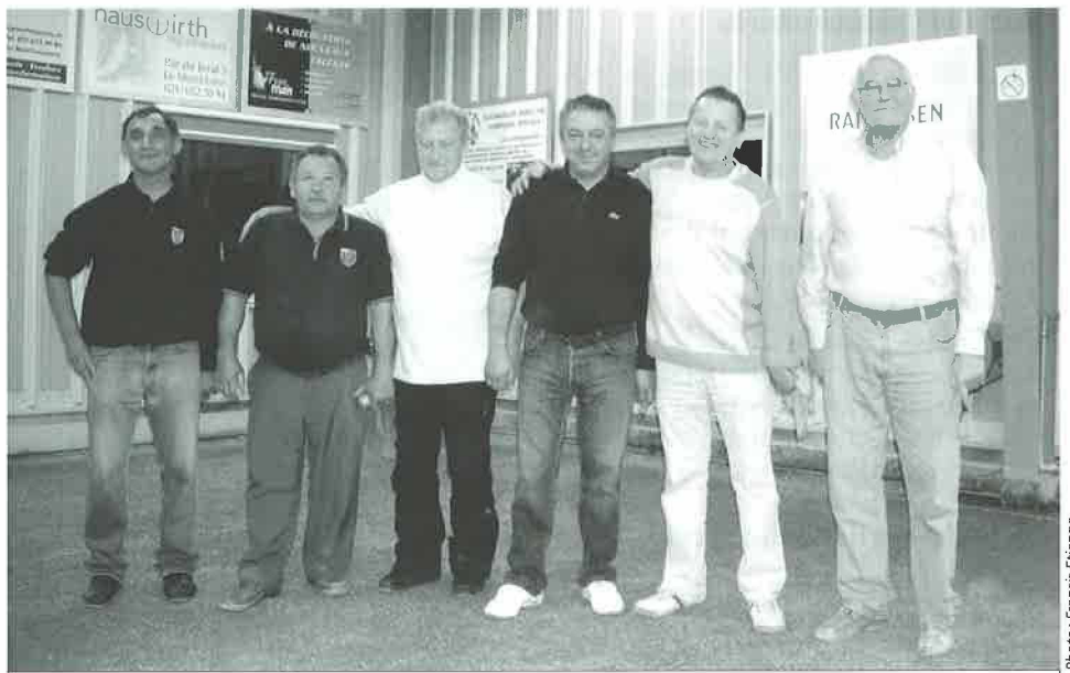
Pétanque: Les finalistes du Mémorial Bonbone