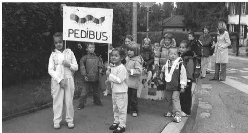
Journée internationale «Allons à pied à l'école»