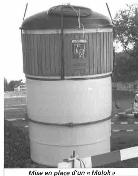
Mise en place d'un « Molok »

Depuis quelques jours, trois « Moloks » sont installés sur le territoire de notre Commune. Il s'agit de cuves partiellement enterrées d'une capacité de 5000 litres permettant le stockage des ordures ménagères à basse température limitant, de ce fait les odeurs nauséabondes. S'intégrant bien dans le site par un aménagement simple, ce système offre de nombreux avantages notamment au niveau économique