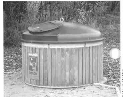
« Molok » installé au chemin des Corjons

les samedis 24 et 31 décembre 2005 de 08h00 à 12h00 exclusivement.