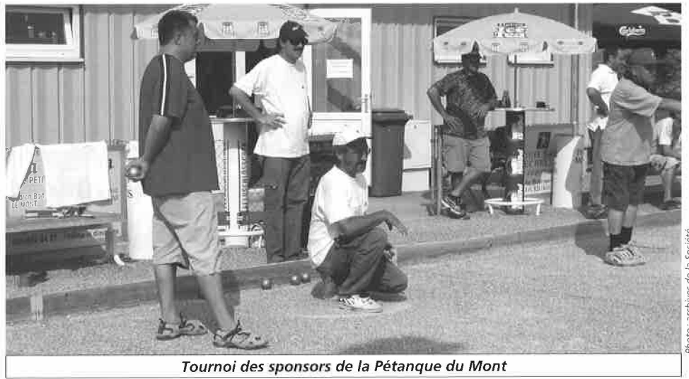
Tournoi des sponsors de la Pétanque du Mont

Message tout particulier à l'attention des jeunes qui seraient intéressés par la pratique d'un instrument de cuivre,