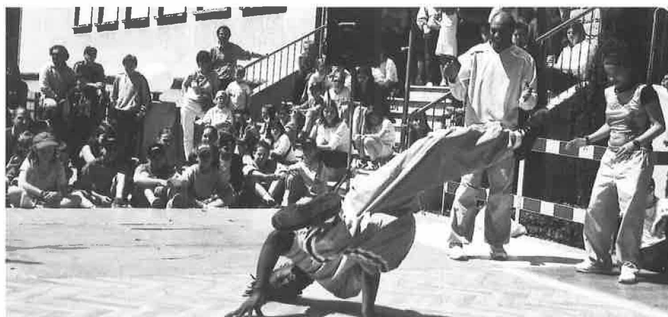
Fête de Mai - Show breakdance du groupe «Scrambling Feet»