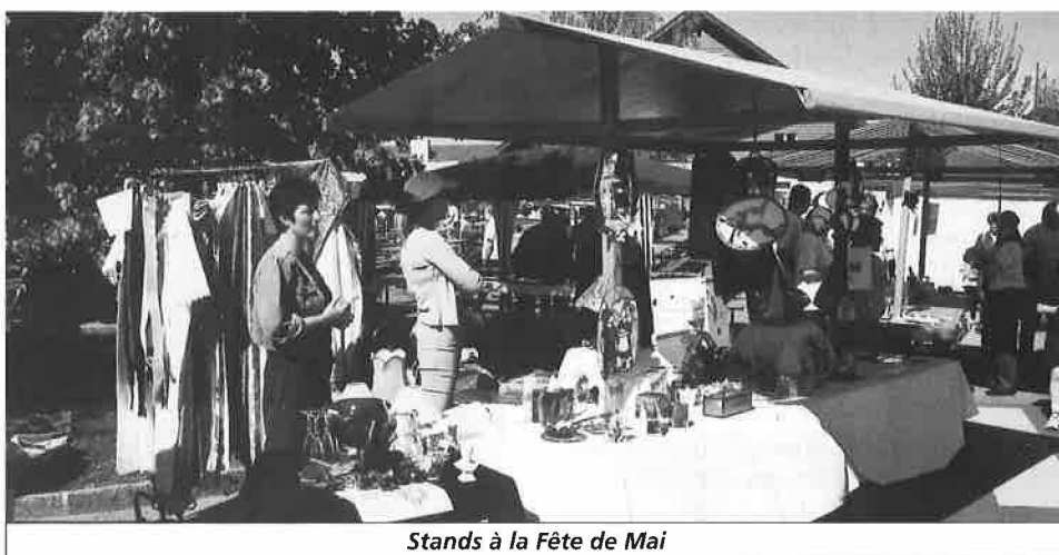
Stands à la Fête de Mai

Les animations n'étaient pas laissées en terre pour cette édition 2001, avec l'Union Instrumentale et ses concerts apéro, les tirs à air comprimé, les maquillages et autres manèges de poneys. Un des grands événements de la journée était bien sûr le show breakdance du groupe « Scrambling Feet ». Prestation qui a connu quelques problèmes techniques. Disons simplement