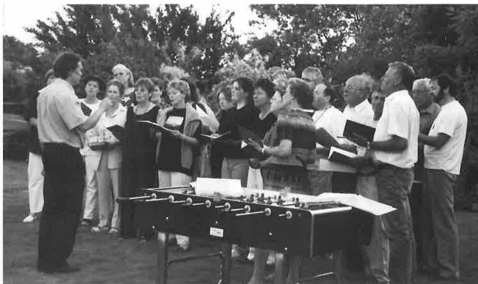
Echo des Bois

Au programme, concert-apéritif dès 10h30, puis choucroute garnie à volonté dès 12 heures environ, assortie d'un tarif préférentiel pour les juniors et la gratuité pour les enfants jusqu'à 12 ans.