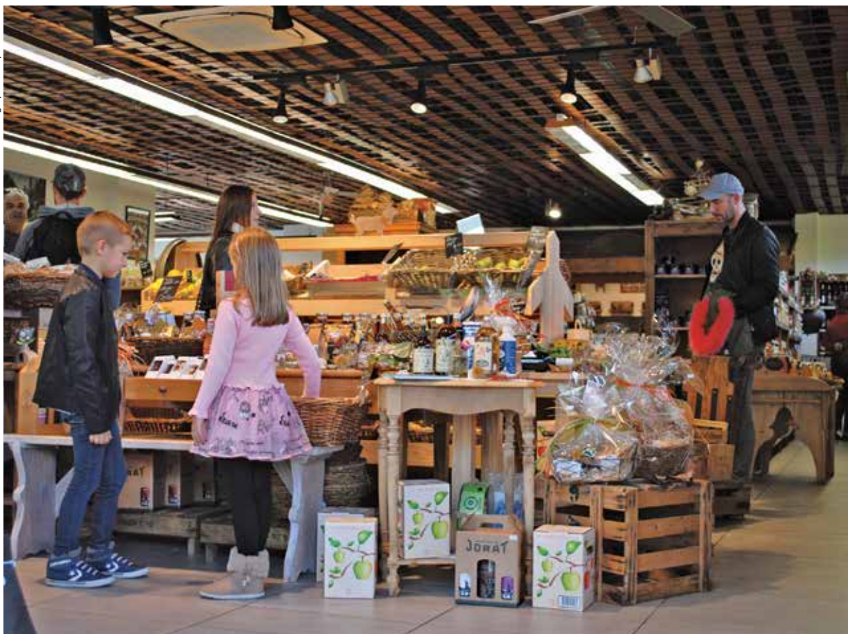
Déjà une ambiance de fête....