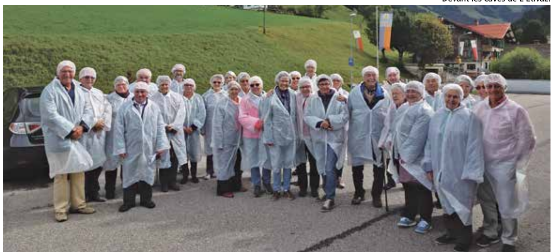
Devant les caves de L'Etivaz.