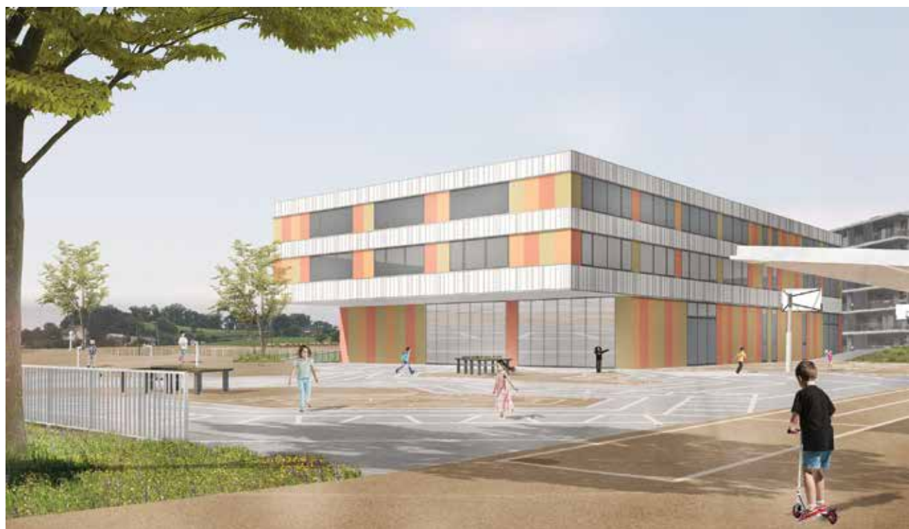
Plan d'aménagement du Rionzi.