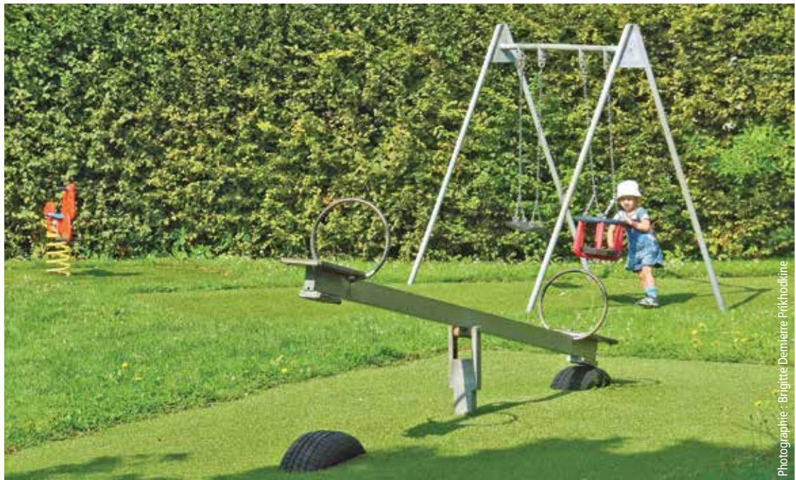
Un plus pour les enfants en balade au Grand-Mont.