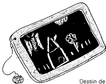
Dessin de Patricia