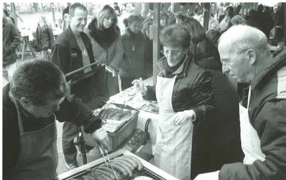
L'Echo des Bois à l'œuvre lors de la Saint-Nicolas