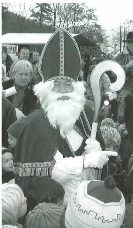
Le Saint-Nicolas 2007