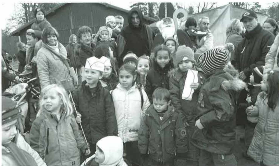
La Saint-Nicolas 2007 au Châtaignier

Téléphone 021 652 68 18 www.echodesbois.com