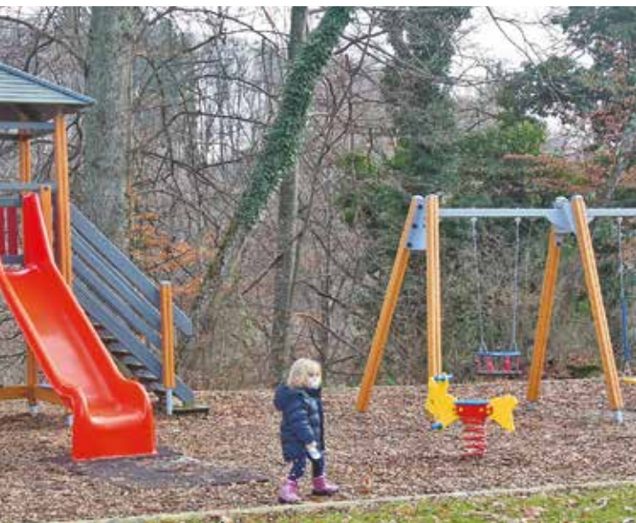
Un bol d'air bienvenu pour toute la famille.