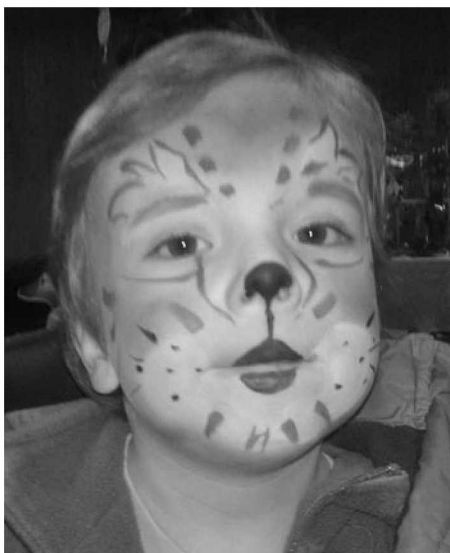
St-Nicolas, garçon maquillé au stand APE