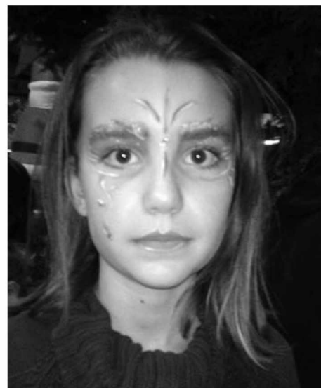
St-Nicolas, fille maquillée au stand APE