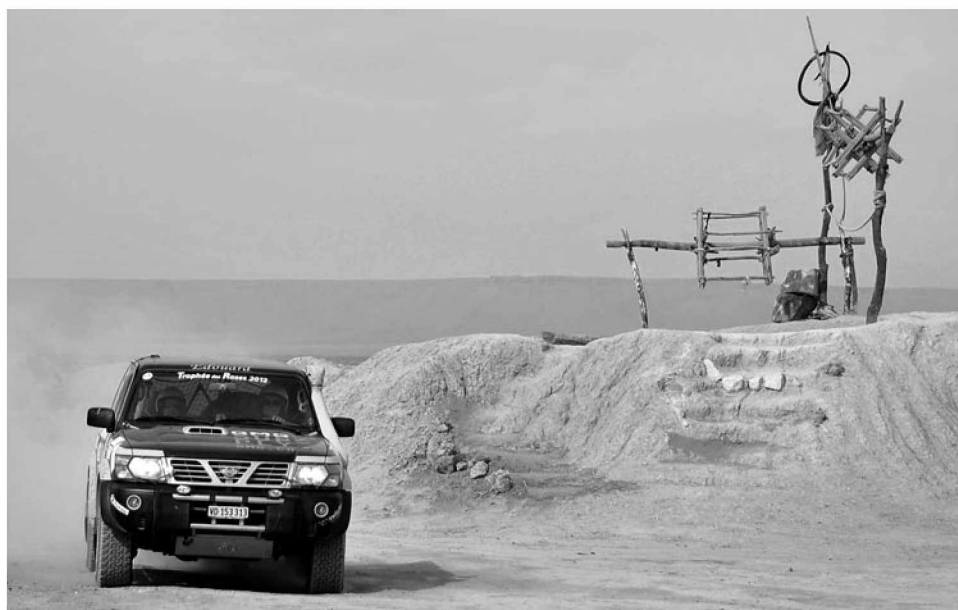
Trophée des roses des sables