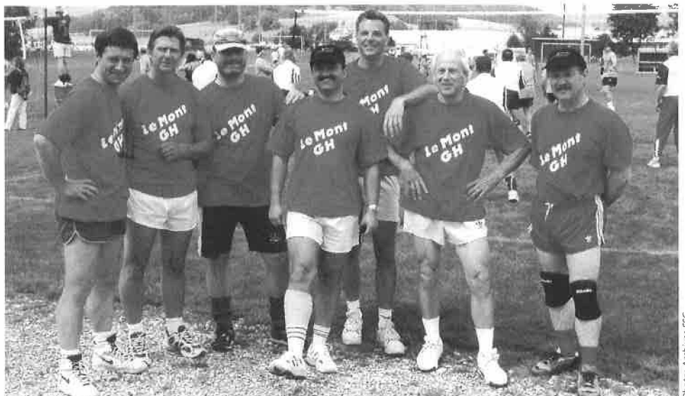
La Gym-hommes à la Fête de Delémont

J'aimerais, au nom de la Société de tir du Châtaignier, souhaiter la bienvenue à tous nos membres à l'occasion de notre tir à prix qui se déroulera le 9 octobre 1999 de 9h30 à 11h30 dans le cadre magnifique de notre stand de tir du Mont. Venez remporter l'un de nos challenges, participez à nos tirs sur cible Châtaignier, cible Manlout, cible Clochette, cible Rionzi, cible Société. De plus, un nouveau challenge des vété-