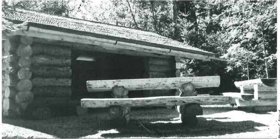
Le couvert forestier de Chatifeuillet

A proximité du refuge, il y a une passerelle en bois qui enjambe la Mèbre et permet aux promeneurs d'emprunter un sentier les conduisant sur les hauts de la commune de Cugy. Cette passerelle en dos d'âne a été construite ce printemps par trois apprentis menuisiers de troisième année de l'Ecole Technique et des Métiers de Lausanne. Comme il s'agit d'une réalisation exposée à l'air du temps et à une humidité constante, ses constructeurs ont utilisé du sapin et du mélèze réifiés. Ce procédé consiste à mettre le bois dans un four à 300 degrés sans oxygène pour qu'il atteigne un taux d'humidité d'environ 4%. Cela le rend beaucoup plus résistant et le protège des attaques de pourriture et d'insectes. Le sapin utilisé pour cette passerelle provient de nos forêts communales.