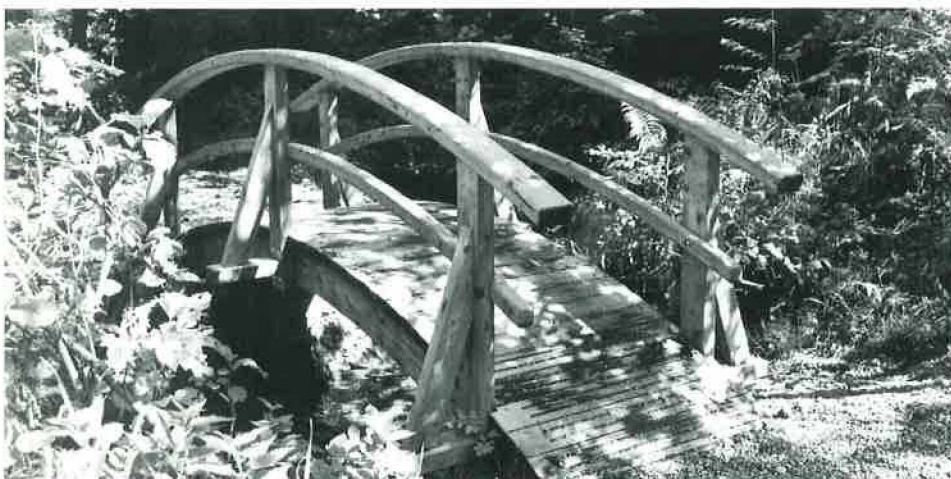
Le pont sur la Mèbre en Chatifeuillet

Le logement des officiers en dehors de l'abri STPA et les achats de nourriture effectués auprès des différents producteurs et commerçants du Mont sont encore plus importants. En effet, selon nos estimations, cela peut atteindre le double du montant des locations encaissées par la Commune. Si l'on veut être complet, pour juger de