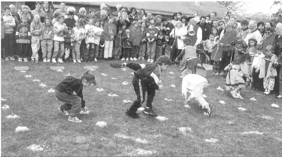
Course aux œufs, édition 1996