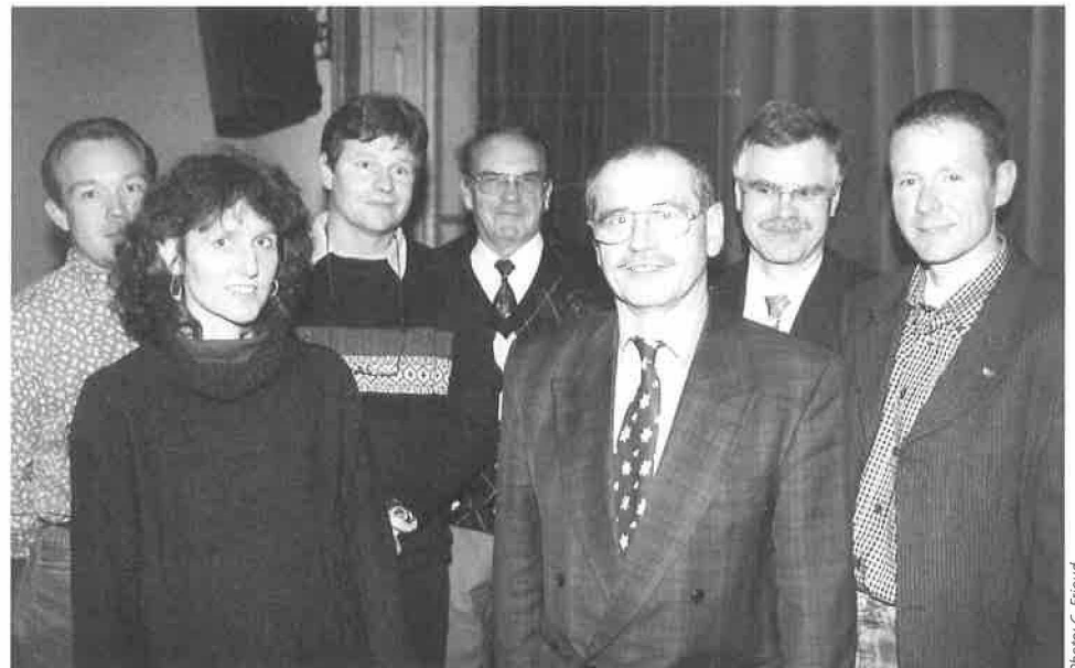
Les membres du comité de la Société de Développement