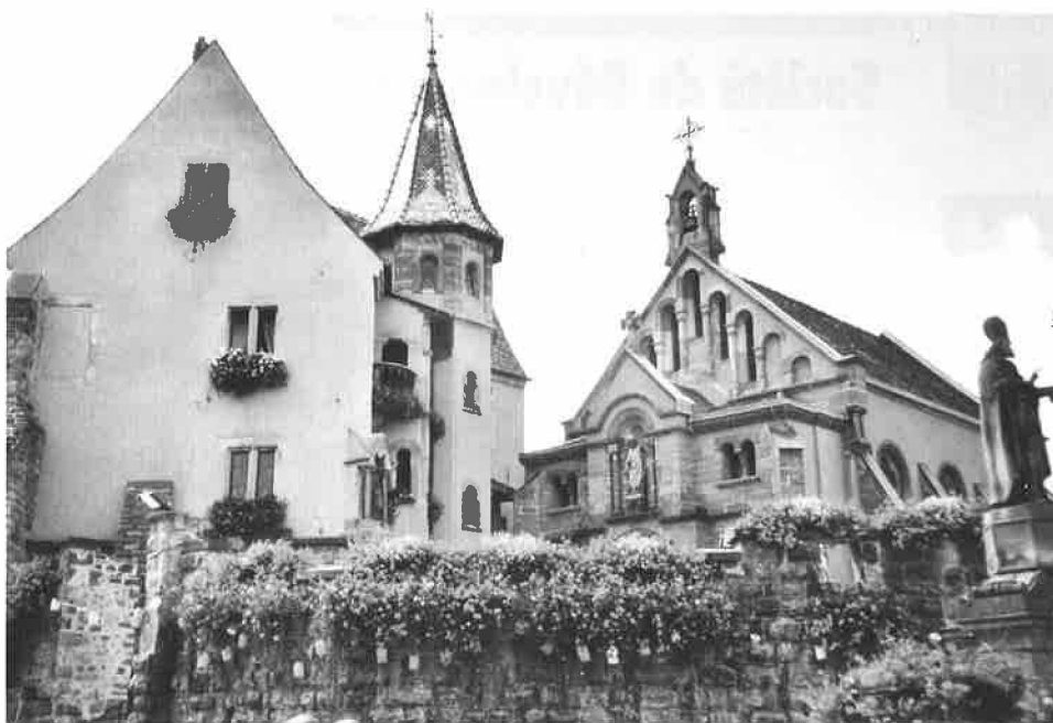
Village d'Egguisheim visité par l'Echo des Bois

Route de Lausanne 16 1052 Le Mont-sur-Lausanne Tél. 021 651 91 91 Fax 021 651 91 92 Mail greffe@lemontsurlausanne.ch