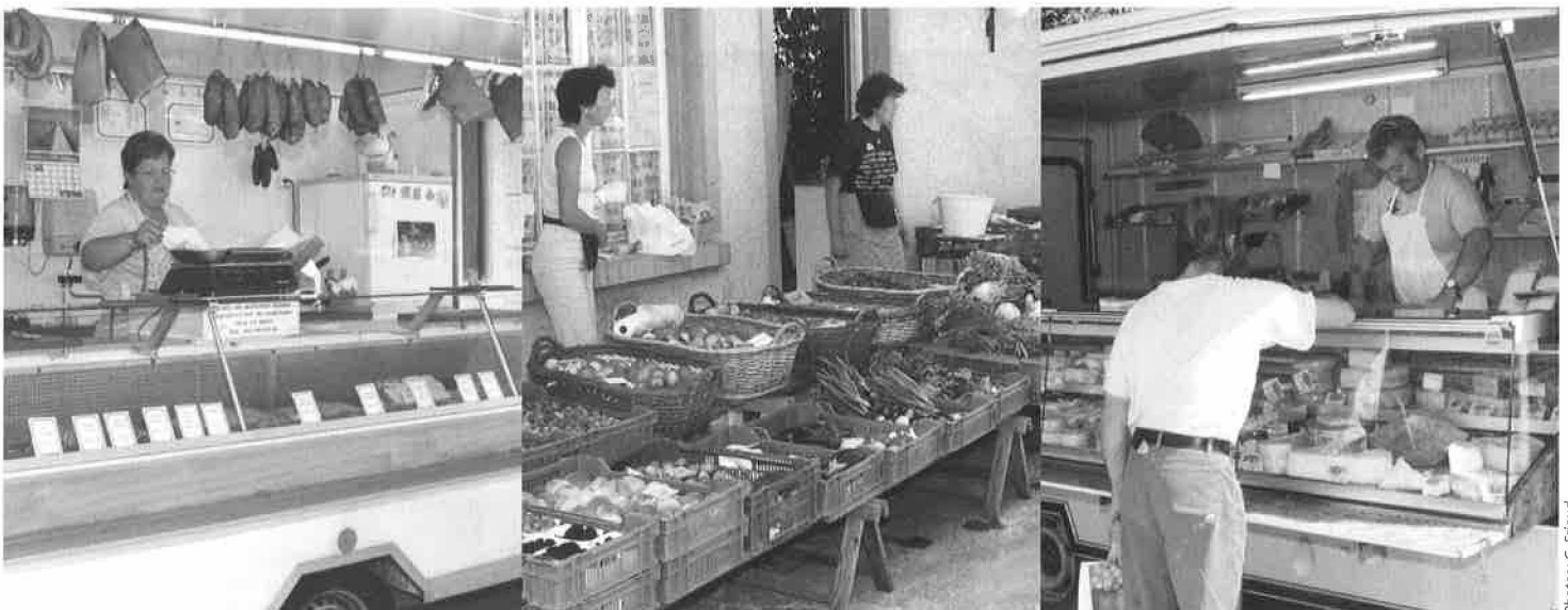
Le marché du Mont sur la place de l'église

Tous les bénéfices seront versés au Burkina Faso.