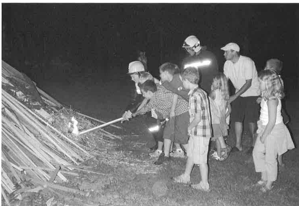
Le feu du 1 er août allumé par les enfants