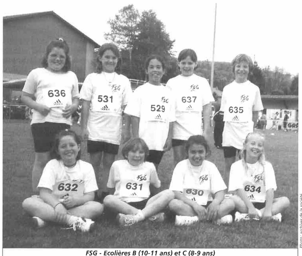
FSG - Ecolières B (10-11 ans) et C (8-9 ans)

De plus, 2 garçons se sont également présentés à Payerne (catégorie Ecoliers