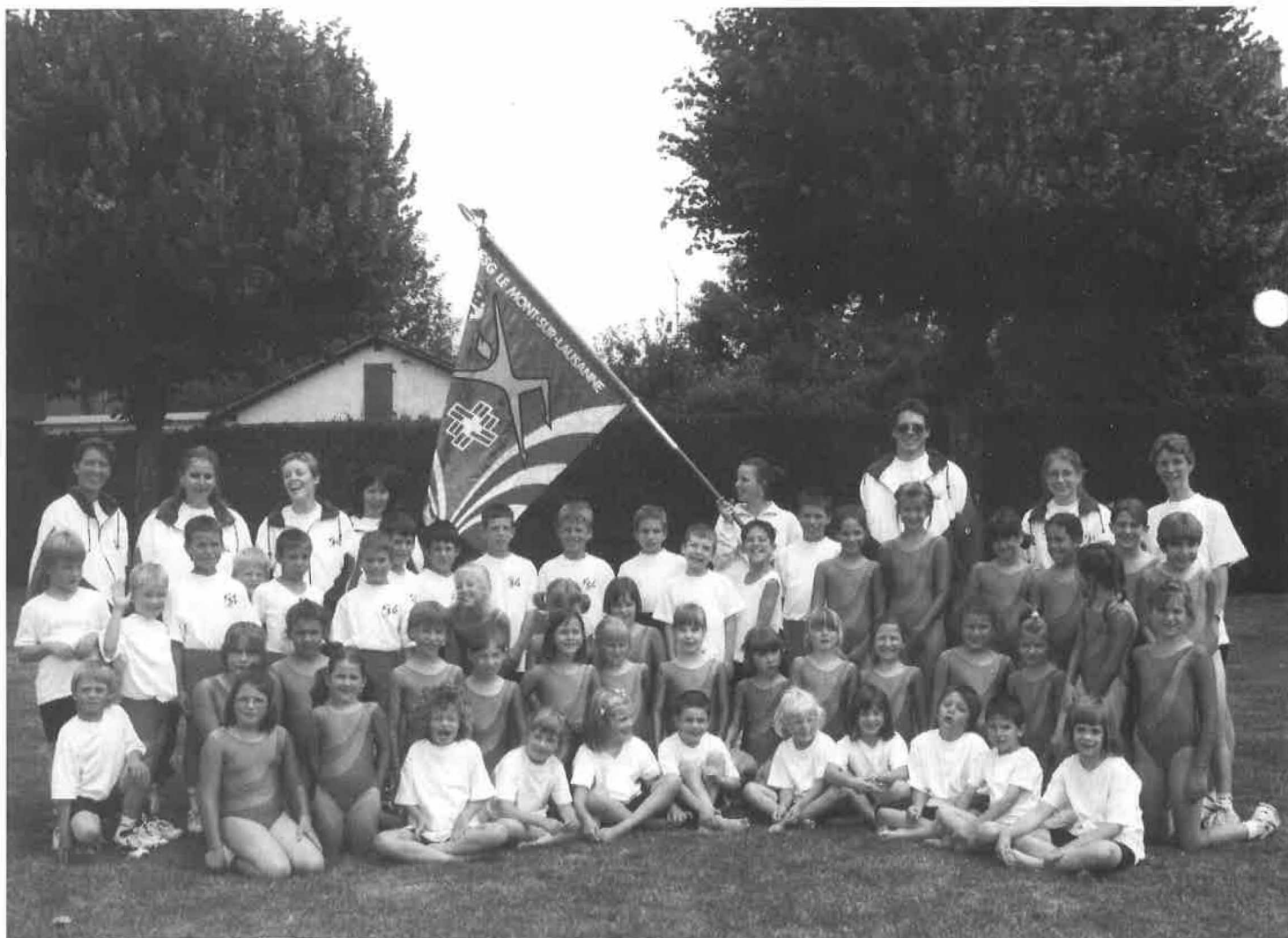
FSG - 2 e week-end de la Fête Cantonale Vaudoise à Payerne

Route de Lausanne 16 1052 Le Mont-sur-Lausanne Tél. (021) 652 01 50 Fax (021) 653 64 29