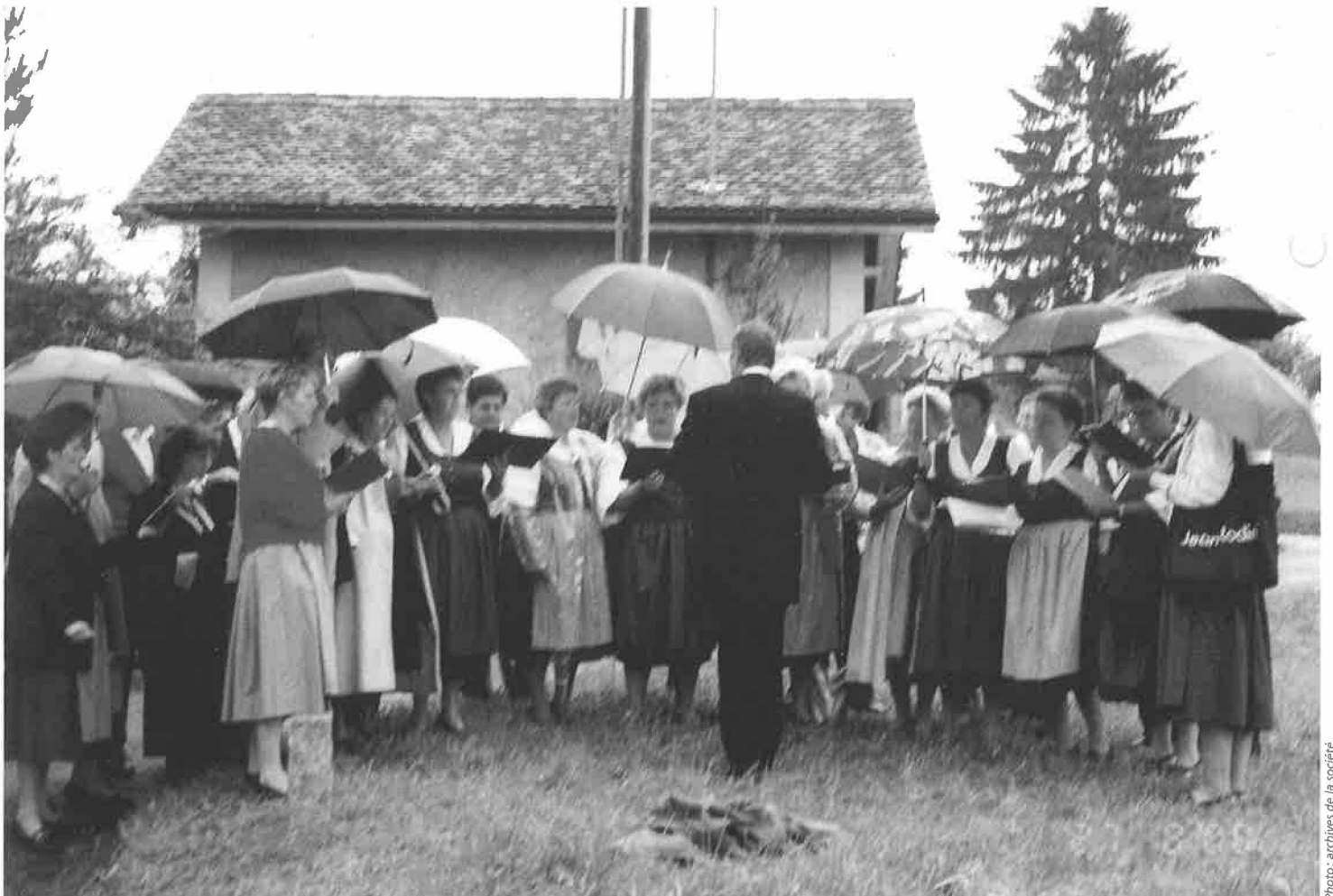
Chœur mixte L'Echo des Bois

Deux moniteurs(trices) pour animer le groupe jeunesse filles, 10-14 ans. Il n'est pas nécessaire d'être un sportif de haut niveau, mais avoir envie de bouger et faire preuve de motivation pour servir de locomotive à ce groupe d'une quinzaine de jeunes filles. Pour tous renseignements complémentaires, vous pou-