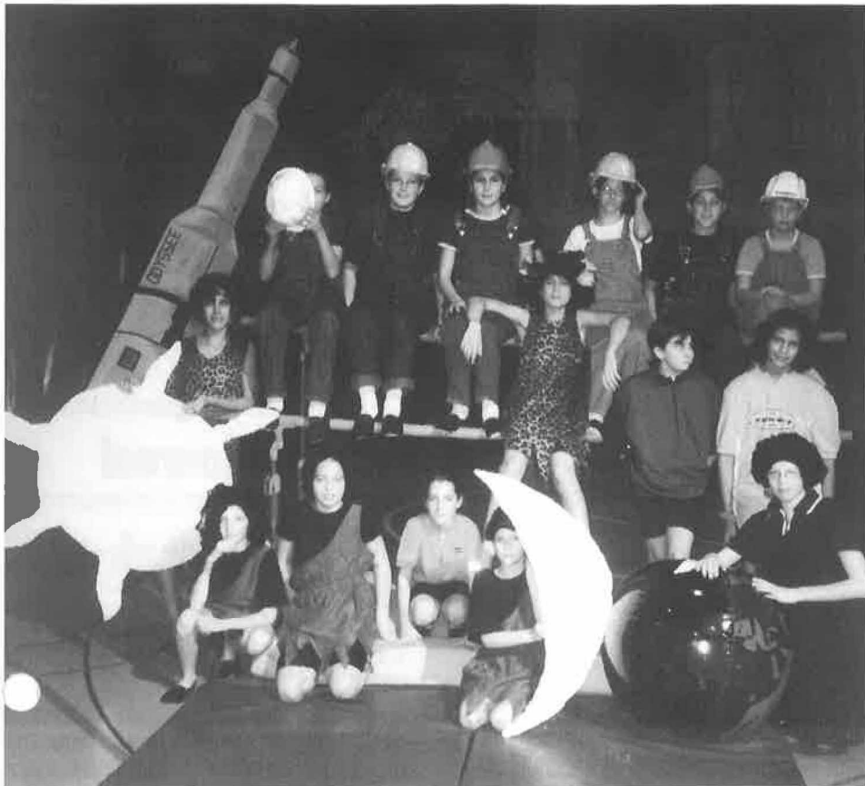
FSG Le Mont - Groupe jeunesse filles, 10-14 ans