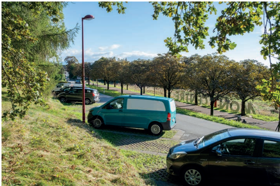
Le stationnement sur les places 23 à 42 de la route de Coppoz est désormais limité à 8h.

(vers le n°90), du chemin du Couchant et du chemin du Saux sont limités à 4h, de 7h à 19h, du lundi au samedi ; • les parkings de la route des Martines-Clochatte et du chemin des Piécettes sont limités à 3h, de 7h à 19h, du lundi au samedi.