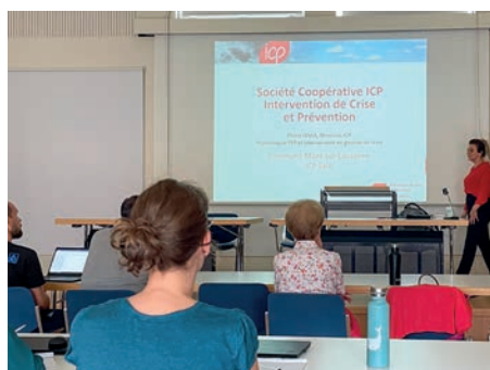
Présentation au personnel communal du nouveau service ICP Safe.

La Municipalité du Mont-sur-Lausanne souhaite que chaque membre de l'administration trouve, dans la réalisation de ses activités, des conditions de travail propices à son bien-être professionnel. Elle met ainsi à disposition de l'ensemble du personnel, depuis septembre 2023, un service de soutien et de personne de confiance nommé « ICP Safe ».