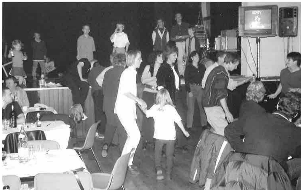
Le Karaoké à la soirée familiale du FC Le Mont à la grande salle du Petit-Mont