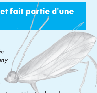
Phrygane adulte dessinée par Tham Pham et Anthony Parra Ortega (10VG2)

la diversité des invertébrés dans les cours d'eau, il est possible de détecter les changements et les problèmes potentiels liés à la pollution de l'eau, contribuant ainsi à la préservation et à la gestion durable des ressources hydriques.