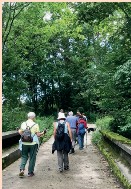
Les marches en forêt sont organisées chaque premier lundi du mois par le Mont Solidaire.