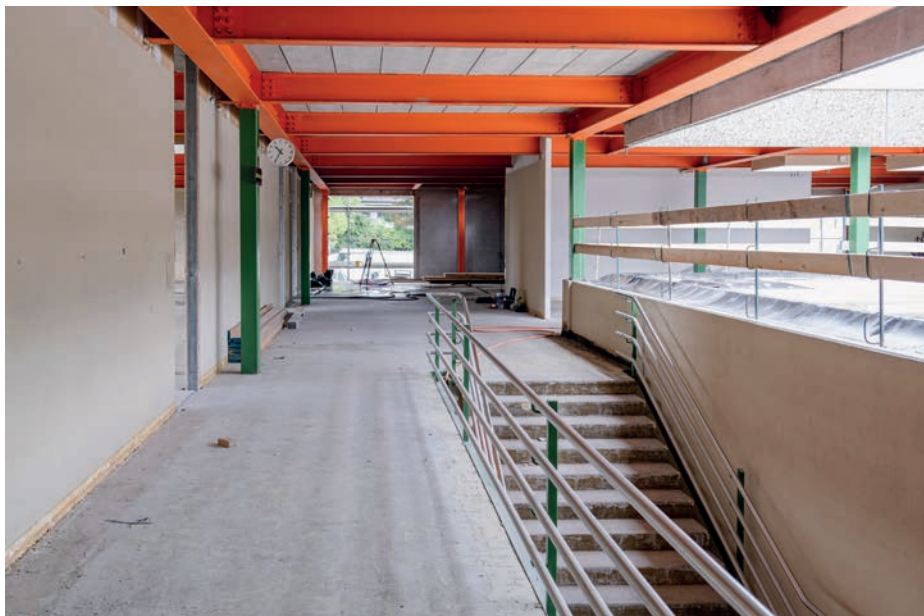
En 2022, la transformation et la surélévation du collège du Mottier (chantier toujours en cours) ont représenté un investissement pour la Commune de CHF 7,04 millions.

L'année 2022 n'a pas été aussi active que prévu en matière d'investissements.