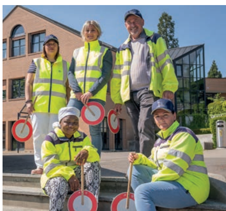
Nos cinq patrouilleurs scolaires

La POLA compte également dans ses rangs cinq patrouilleurs scolaires, qui permettent de sécuriser les abords des écoles du Mont, et une contrôleuse des champignons, qui assure un service gratuit apprécié de la population.