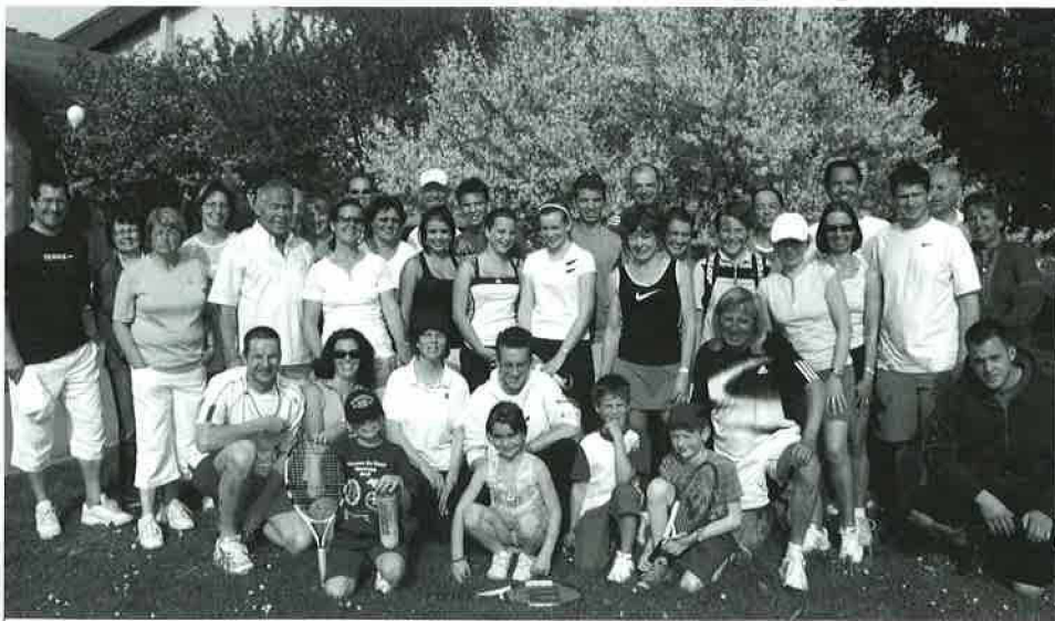
Tennis-Club: Les participants au tournoi d'ouverture