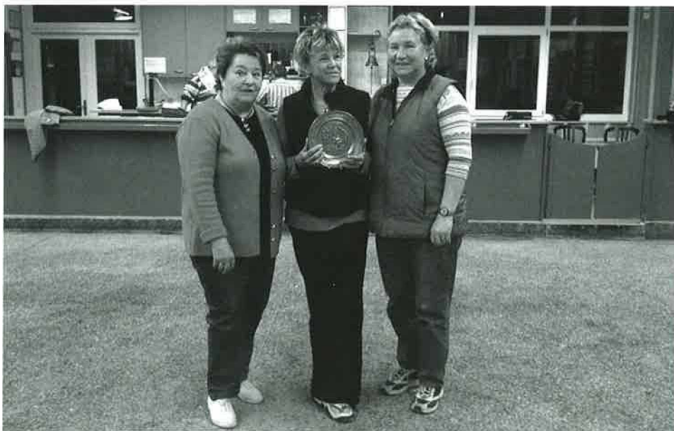
Pétanque: Le podium du concours des Paysannes vaudoises