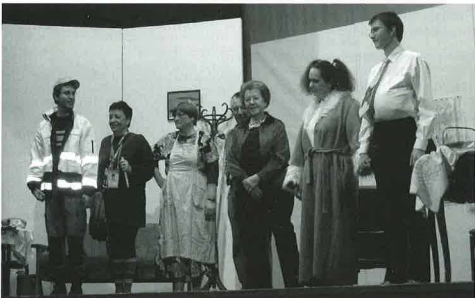
Echo des Bois: Extrait du théâtre