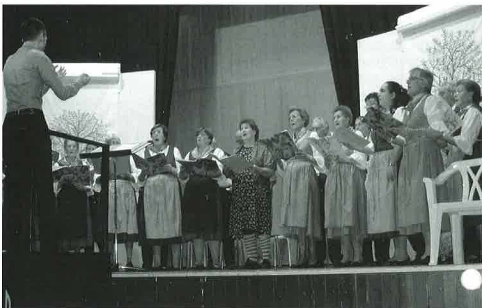
Echo des Bois: Extrait du concert