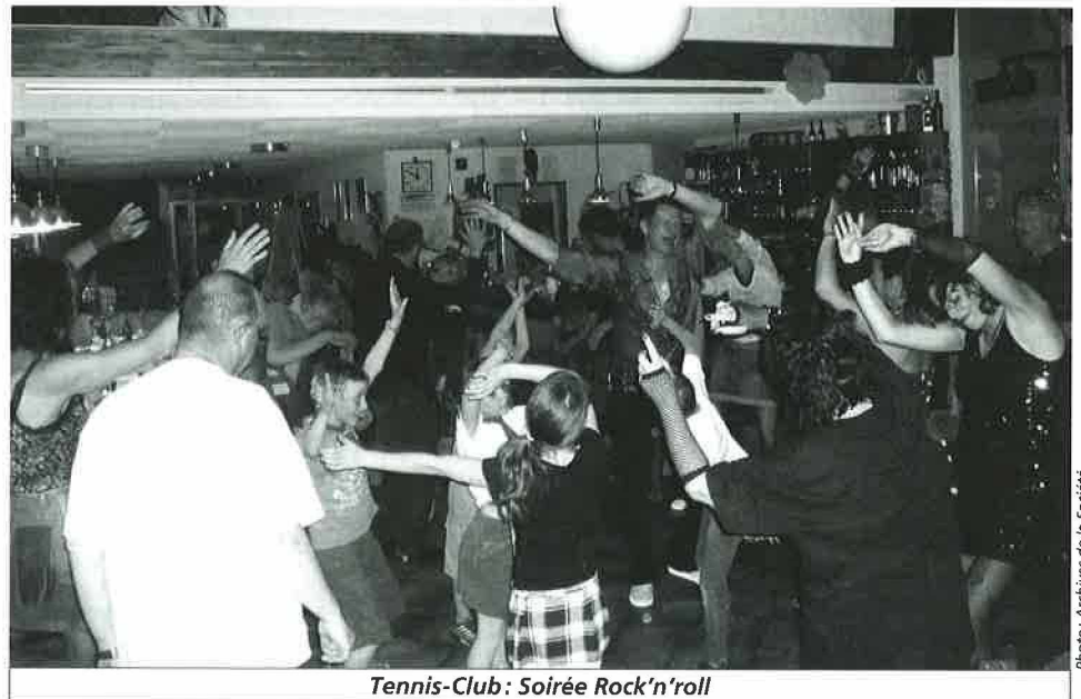
Tennis-Club: Soirée Rock'n'roll

Dans une convivialité coutumière et un fair-play exemplaire, l'esprit de compétition demeurait cependant avec une