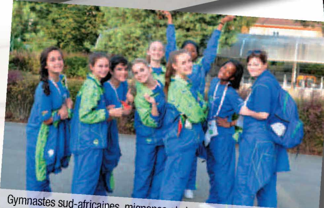
Gymnastes sud-africaines, mignonnes et charmeuses