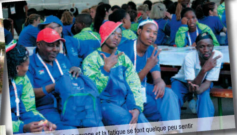
Le long voyage et la fatigue se font quelque peu sentir