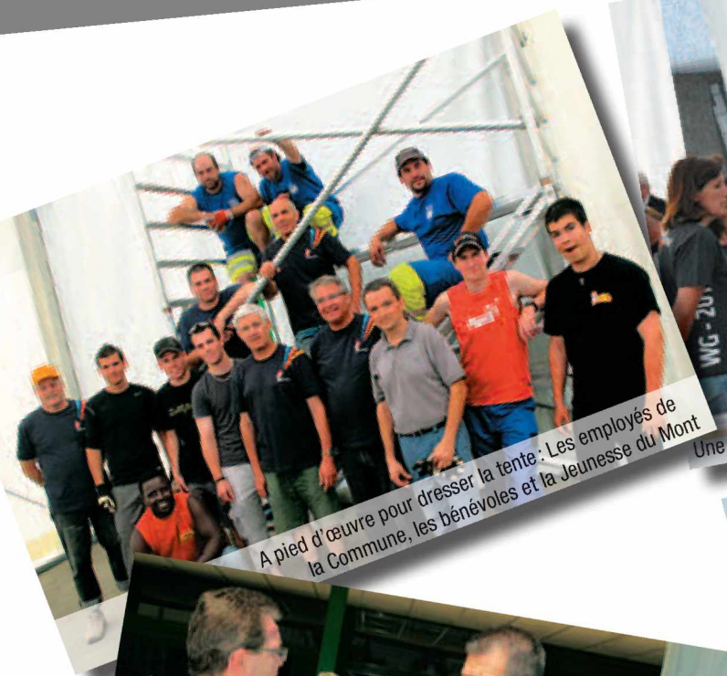
A pied d'œuvre pour dresser la tente : Les employés de la Commune, les bénévoles et la Jeunesse du Mont