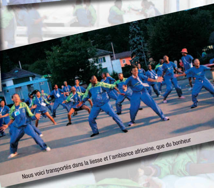
Nous voici transportés dans la liesse et l'ambiance africaine, que du bonheur