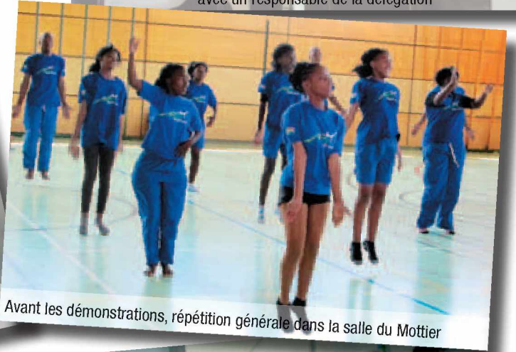
Avant les démonstrations, répétition générale dans la salle du Mottier