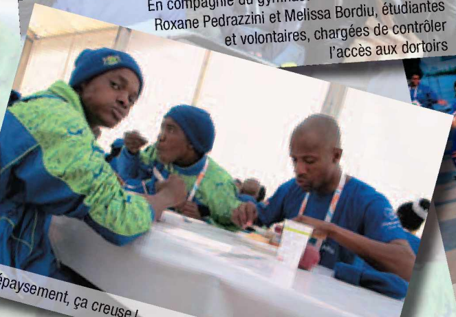
Le dépaysement, ça creuse!