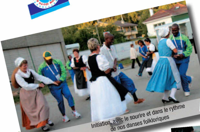
Initiation, avec le sourire et dans le rythme de nos danses folkloriques