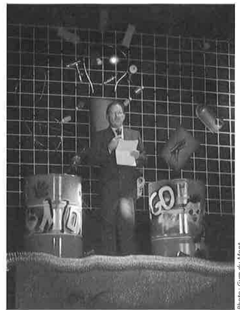
Le président Alix Briod lors de son discours