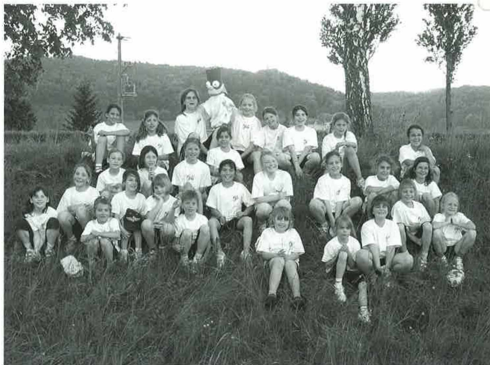
FSG, Jeunesse filles