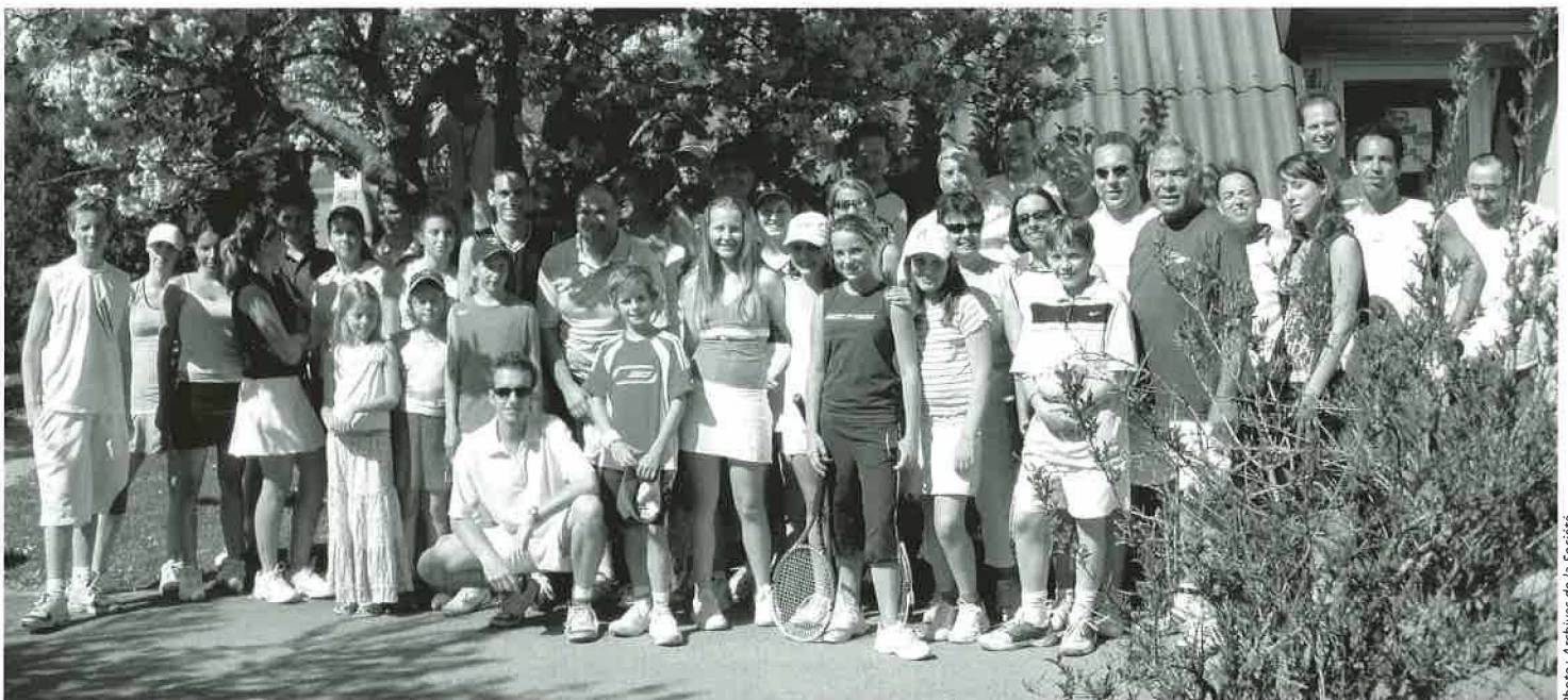
Tennis-Club Le Châtaignier

Route de Lausanne 16 1052 Le Mont-sur-Lausanne Tél. 021 651 91 91 Fax 021 651 91 92 Mail greffe@lemontsurlausanne.ch