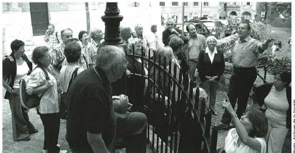
Echo des Bois, Sortie annuelle 2006 à Genève