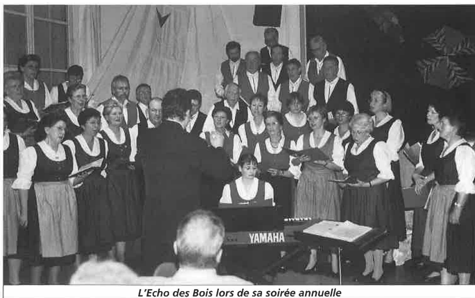
L'Echo des Bois lors de sa soirée annuelle

Route de Lausanne 16 1052 Le Mont-sur-Lausanne Tél. 021 651 91 91 Fax 021 651 91 92 Mail greffe@lemontsurlausanne.ch