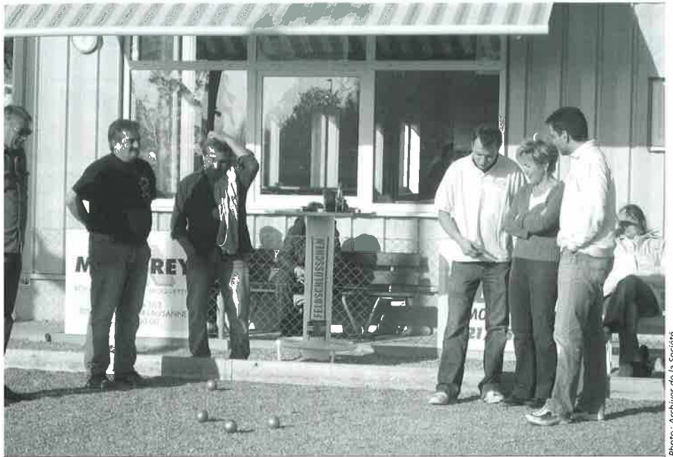
Une équipe du Mont et des Alliés, sous un beau soleil, lors du « Mémorial Bonbonne »

Le 3 novembre nous avons organisé avec nos ami(e)s des Alliés le Mémorial Bonbonne pour sa 6 e édition, ce tournoi a eu un vif succès et s'est déroulé comme à son habitude dans une très belle ambiance... Le Club de Crissier a, pour la 2 e année consécutive, remporté la victoire.