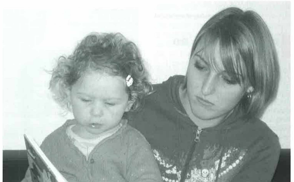
Devenir « Maman de jour »

L'APE est une association de parents qui s'impliquent dans la scolarité de leur(s) enfant(s). Des parents qui désirent participer à la vie de l'établissement scolaire et comprendre les rouages de l'école vaudoise.