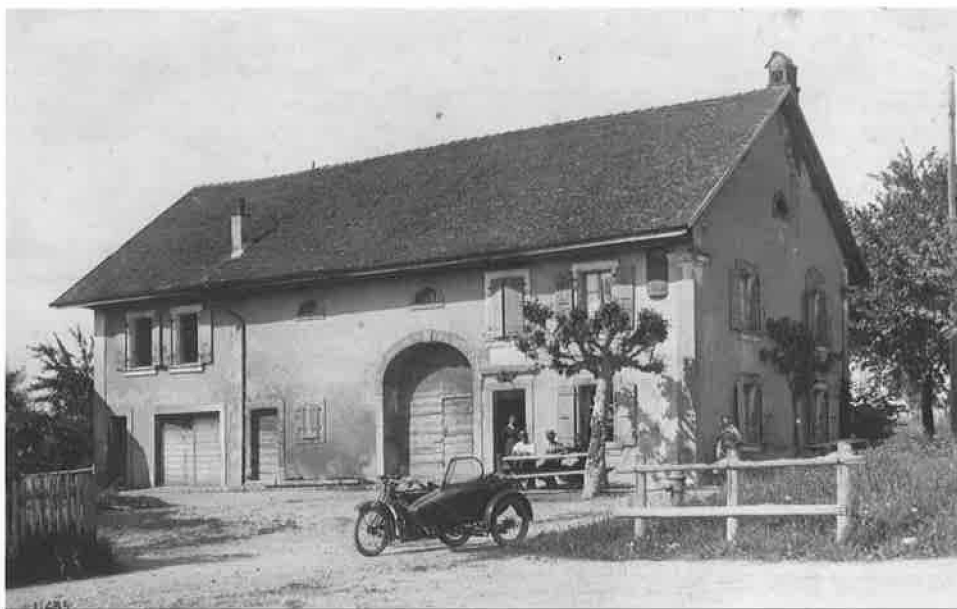
« La Bastide » vers 1900