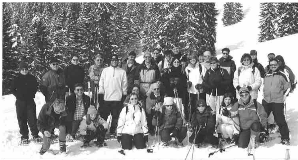
Sortie en raquettes de la FSG