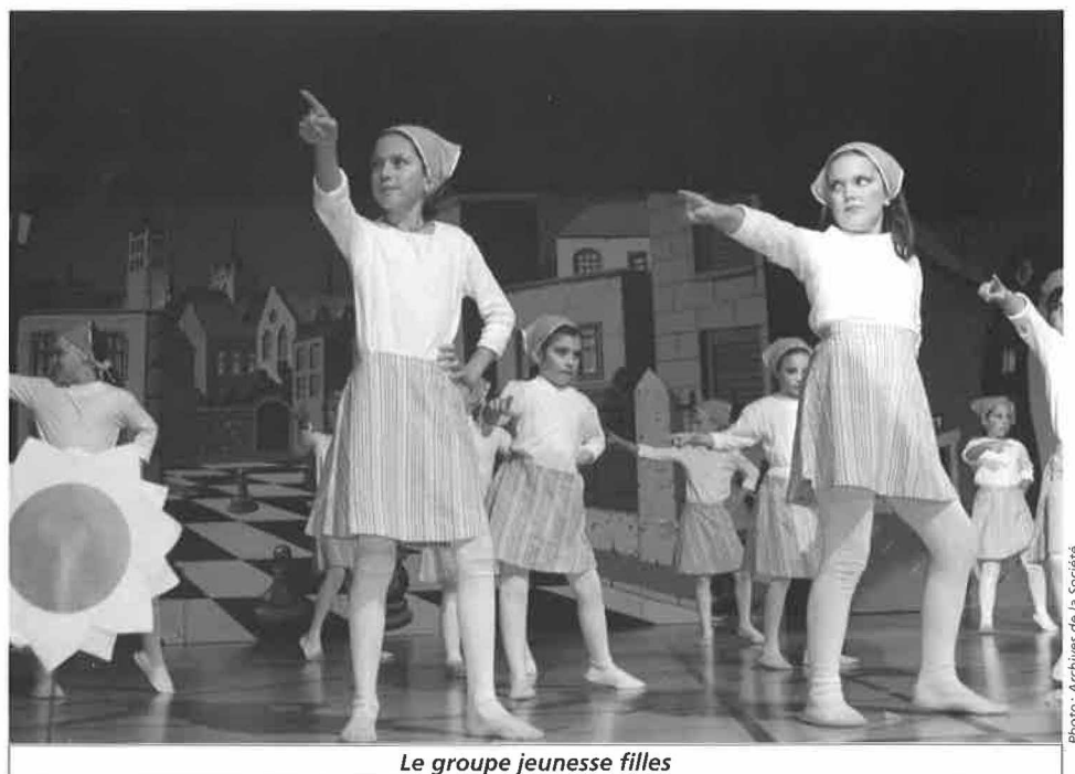
Le groupe jeunesse filles