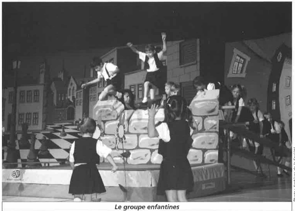
Le groupe enfantines