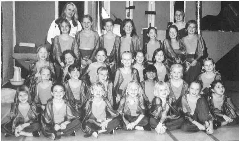
Groupe Jeunesse filles 7-10 ans