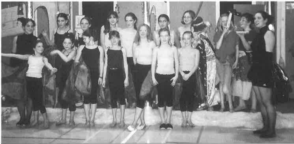
Groupe Jeunesse filles 11-16 ans