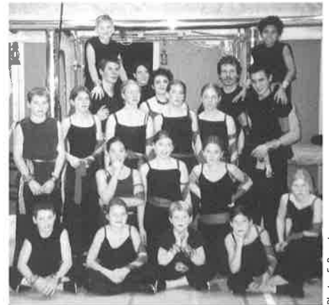
Groupe agrès filles-garçons