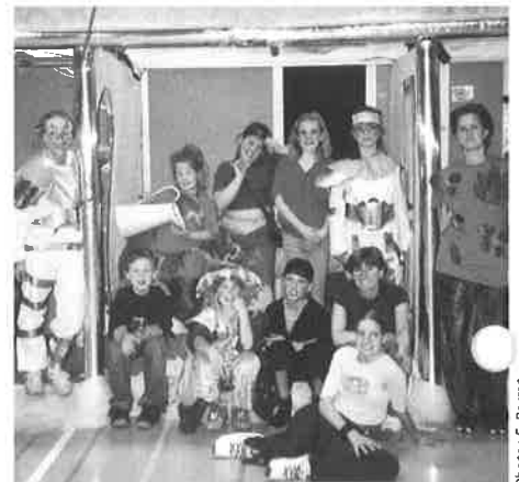
Groupe de théâtre des enfants

Nous vous donnons tous rendez-vous le 12 avril 2003 à la salle de gymnastique du Mottier, l'entrée est libre, une petite visite de votre part leur fera plaisir vous serez les bienvenus, une buvette est organisée pour vous accueillir, soutenez ces gymnastes par votre présence, ils le méritent bien; certains s'entraînent plus de quatre fois par semaine et plusieurs gymnastes sont domiciliés dans notre commune.