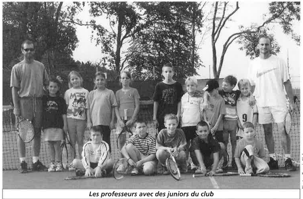
Les professeurs avec des juniors du club